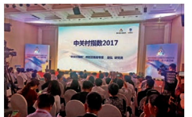
■中關村指數2017發佈現場

此外，中關村企業瞄準國際前沿，通過海外併購等方式加快整合全球高端創新資源。2016年，中關村企業發起的境外併購案例52起，較上年增加15起；併購金額為685.6億元，同比增長15.7%。中關村在海德堡發起設立的中關村德國科技創新中心，成為銜接兩地創新資源的雙向流通渠道和資源共享池。