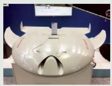
■高動態自組網智能協同系統

開幕式上，零零無限、聲智科技、羅格數據、泰科天潤四家前沿技術企業進行了精彩路演。參賽企業紛紛表示，集中精力用最好的狀態參與比賽。