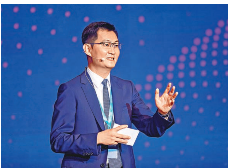
中金公司向馬化騰旗下騰訊一間子公司配售約2.075億股新H股。資料圖片

就引入騰訊為戰略投資者,中金首席執行官畢建偉表示,相信此次合作有助於中金以金融科技加速財富管理轉型,為客戶提供更加差異化的金融解決方案。騰訊控股總裁劉熾平則表示,期望與中金在產品及服務方面進行系列合作,包括向中金提供騰訊