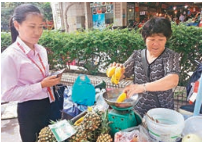
中國的移动支付方便得令人震驚,即使在路邊攤買水果亦可使用支付寶付費。 資料圖片

香港文匯報訊(記者 朱燁 北京報道) 六集電視紀錄片《輝煌中國》昨日播出第二集《創新活力》,從移动支付到共享單車,從「中國製造2025」到物聯網、大數據、雲計算等新技術,從空天領域、海工領域,到芯片等尖端領域,再到參與大科學計劃,這些創新塑造的、面向未來的新型經濟正在助推中國,在新一輪科技革命和產業變革中,實現綜合國力的競爭。