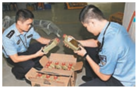
廣州海關昨日摧毀一個走私高檔汽車零件的團夥,初估案值達16.7億元人民幣。

香港文匯報訊(記者 敖敏輝 廣州報道) 昨日凌晨,在海關總署緝私局的統一指揮和廣東分署緝私局的協調下,廣州海關出動20個行