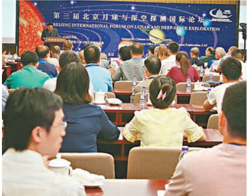
第三屆北京月球與深空探測國際論壇昨日在北京開幕。

香港文匯報訊(記者 劉凝哲 北京報道) 第三屆北京月球與深空探測國際論壇昨日在北京開幕,來自國內外的200多名專家就月球、火星和小行星探測規劃等進行交流探討。最新信息顯示,在未來幾年裡,中國將通過嫦娥五號探測器採集2公斤月球樣品返回地球並開展實驗室研究,首次火星探測任務將展開繞、落、巡科學探測。在國際合作方面,中國航天部門正推進與歐洲太空總署(ESA)、俄羅斯聯邦航天局(FSA)在月球極區探測、樣品合作、月球數據中心等領域積極有序合作。