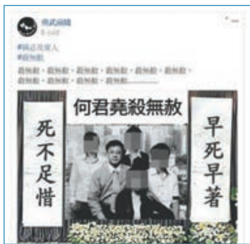
激進「本土派」組織「勇武前綫」也發出有恐嚇成分的帖子。