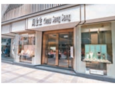
遇劫的珠寶行昨如常營業。

昨日下午1時許，大批機動部隊警員奉召到場協助搜尋其他被劫鑽飾下落。被盜作案電單車的朱姓男車主(44