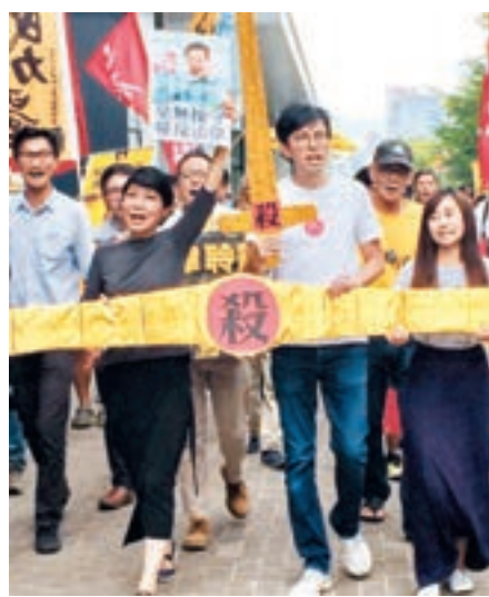
反對派遊行至律師會施壓。

事。」 喂，阿哥，點解呢班人咁囂張，就係因為各反對派政黨，特別係俗稱「大狀黨」嘅公民黨，之前在「雙學三丑」案猛咁抹黑同意法院判決兩個律師會，話兩個律師會「聽指令做嘢」，打擊兩會公信力，但當時佢兄呢就不吭一聲，先令到各反對派政黨向律師會施壓，試圖將專業政治