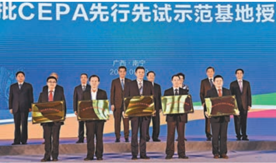
■「一帶一路」桂港合作論壇上，舉行了廣西第一批CEPA先行先試示範基地授牌儀式。圖為授牌儀式現場。

廣西壯族自治區黨委書記彭清華在論壇發言時說，廣西生態環境優良，資源獨特，西部大開發政策與沿海沿邊開放開發政策、民族優惠政策疊加，發展潛力巨大，廣西與香港地緣相近，同為「一帶一