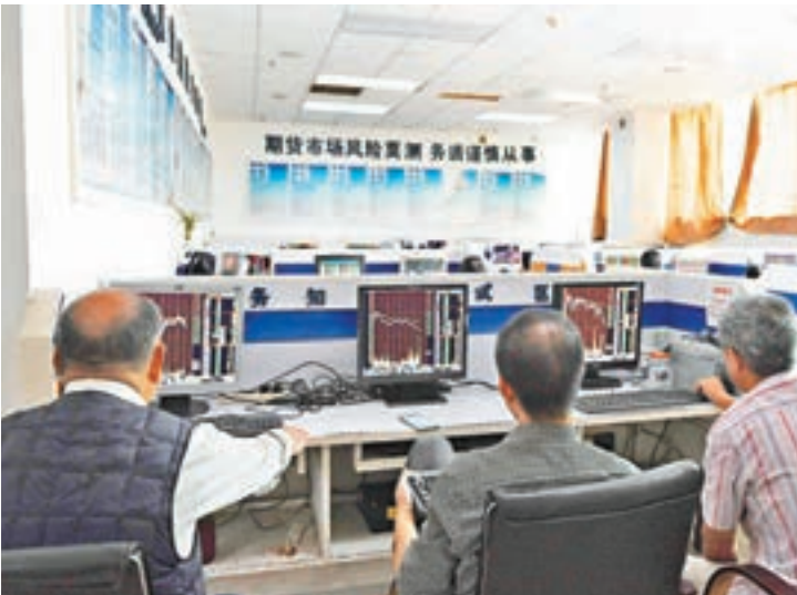
■A股地產股昨逆勢走強，但市場觀望美國議息，滬深三大指數全部報跌收市。圖為成都某證券交易大廳內股民關注股市行情。

大城市限購令未有鬆口，多數分析認為今年樓市「金九銀十」或不可期，但對上市公司而言或是有利有弊。廣發證券就指，在庫存減少的情況下，企業庫存流動性折價將大幅收窄，地產企業資產價值估值較低，未來將會出現補漲。不過，外圍市場觀望周四美聯儲議息，觀望情緒也蔓延到A股。雖然銀行、保險等權重板塊小幅收紅，但未能扭轉大市收跌。滬綜指全日下跌6點或0.18%，報