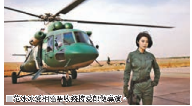
■范冰冰愛相隨唔收錢撐李晨做導演。