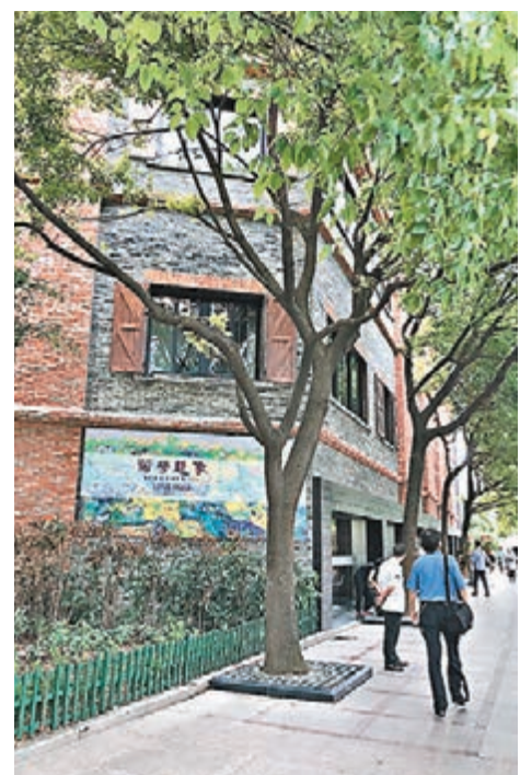
上海「八號橋藝術空間——1908糧倉」具有百年歷史