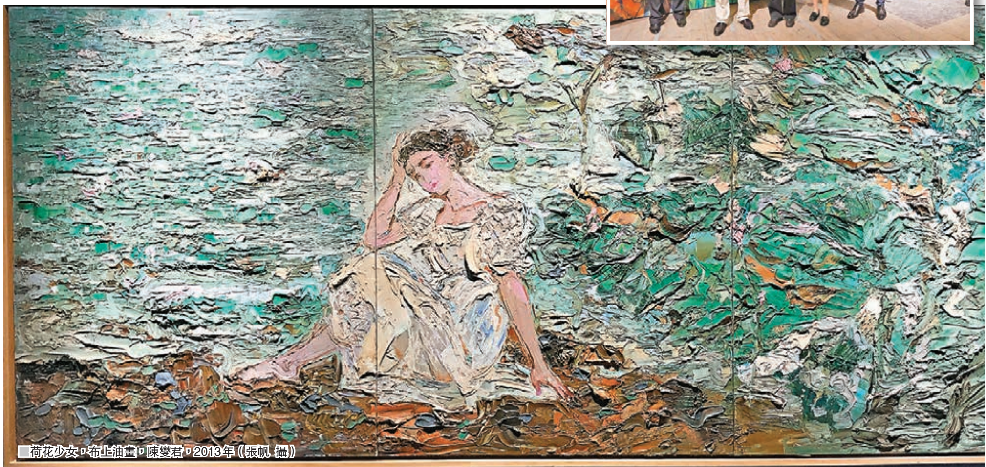
《荷花少女》布上油畫，陳燮君，2013年 (張帆攝)

本次展覽由上海市公共關係協會、上海市海外交流協會、上海市僑界油畫家聯誼會主辦。值得一提的是，展覽的舉辦地「八號橋藝術空間——1908糧倉」位於黃浦區蘇州河畔，是滬上新開闢的藝術空間，其前身為大享杜月笙的糧倉，已經有一百多年歷史。在這樣的場館舉辦展覽，也頗符合展覽「中西結合」的意境。