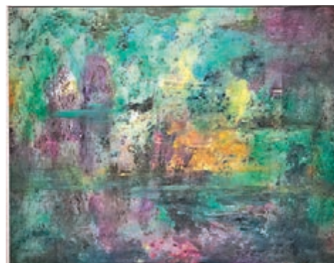
《荷花嬌欲語》，紙上油畫，陳穎，2017年

「暗香抒懷」為其五。荷有風骨，蓮有品格；暗香抒懷，清風點讀；荷塘詩語，日月對話；唐宋荷風，穿越時空。布上油畫作品《清靜本因心》、《華貴雍容終不改》、《有人相憶》、《卷舒開合任天真》和《美學漫步》等積極刻畫荷之本心、蓮之魂魄。