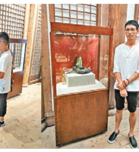
市民參觀「獨具匠心——第二屆青年雕刻藝術展」