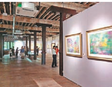
展覽現場的地板和樑柱已有百年歷史