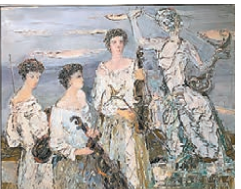
《飄向遠方的旋律》，布上油畫，陳燮君，2013年