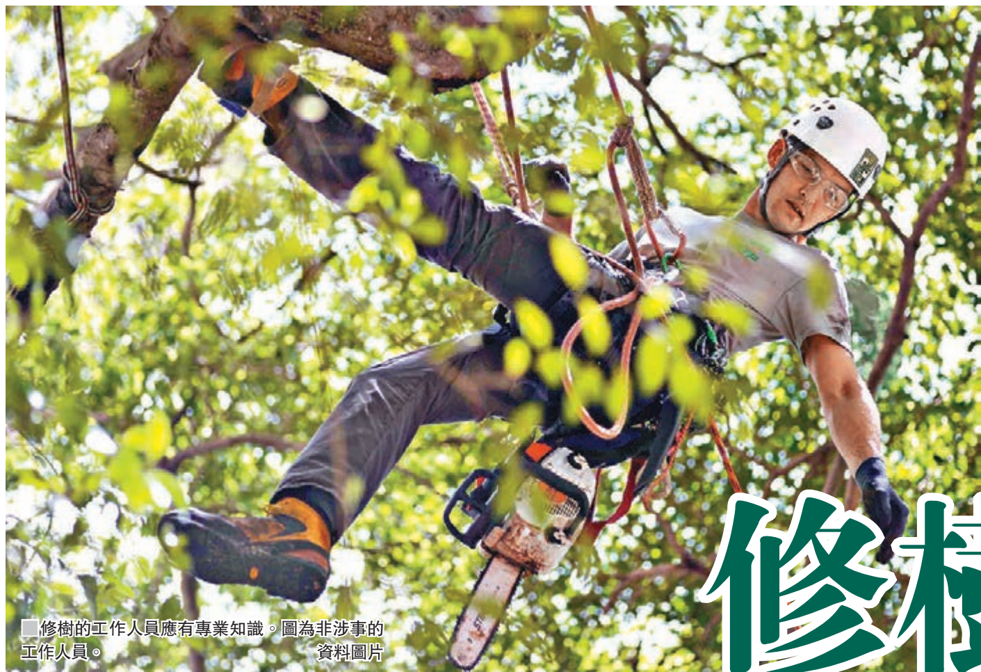
修樹的工作人員應有專業知識。圖為非涉事的工作人員。資料圖片