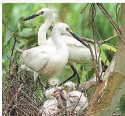
多種雀鳥以本港作為繁殖地。資料圖片

《樹木風險評估及管理安排指引》 這份指引在2010年1月首次頒佈，並已進行多次修訂，是政府各個樹木管理部門及社會大眾管理樹木的參考文件，先進行以地點為本的評估，即該處樹木倒塌是否會影響公眾安全，然後再進行以樹木為本的評估，即樹木是否健康、有沒有倒塌風險，評估後再對有風險的樹木進行減低風險的措施，如修剪、除蟲，若樹木有倒塌危機，則可移除及補償種植。