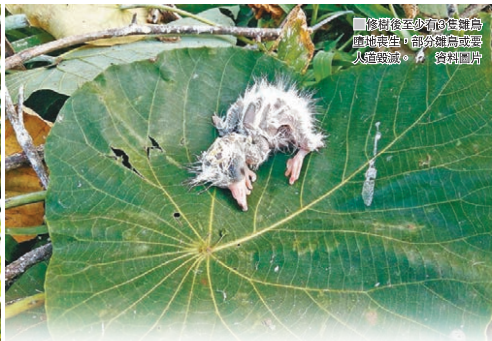
修樹後至少有3隻雛鳥墮地喪生，部分雛鳥或要人道毀滅。資料圖片