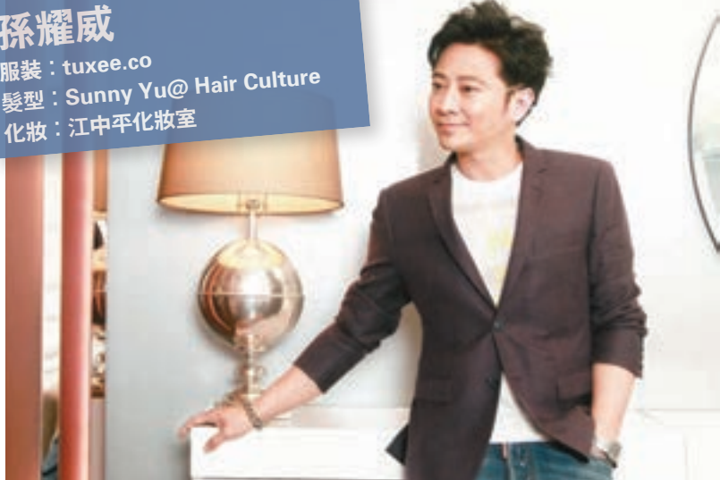
孫耀威小時候是個很叛逆、不平則鳴的人。

服裝：tuxee.co 髮型：Sunny Yu@ Hair Culture 化妝：江中平化妝室