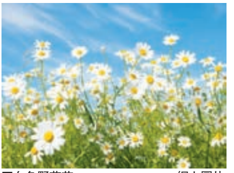
白色野菊花。 網上圖片

菊花深居在寺廟裡，輻光養晦，很適合它「隱者」身份。我也晚看不到僧廟裡花高十尺的菊花。濟南趵突泉公園的菊展盛會，彌補了這一缺憾。每年的十月份，菊花集體亮相，重磅來襲，引來觀者如潮。去年，我和朋友參觀菊展，夾雜在熙熙攘攘的人群中，欣然發現許多花冠如斗的菊花品種，朵朵驚艷，美絕人寰。現在的栽培技術迅猛發展，菊展上的菊花千姿百態，爭奇鬥妍，肯定比亮一僧人精心培育的那些要好看得多。