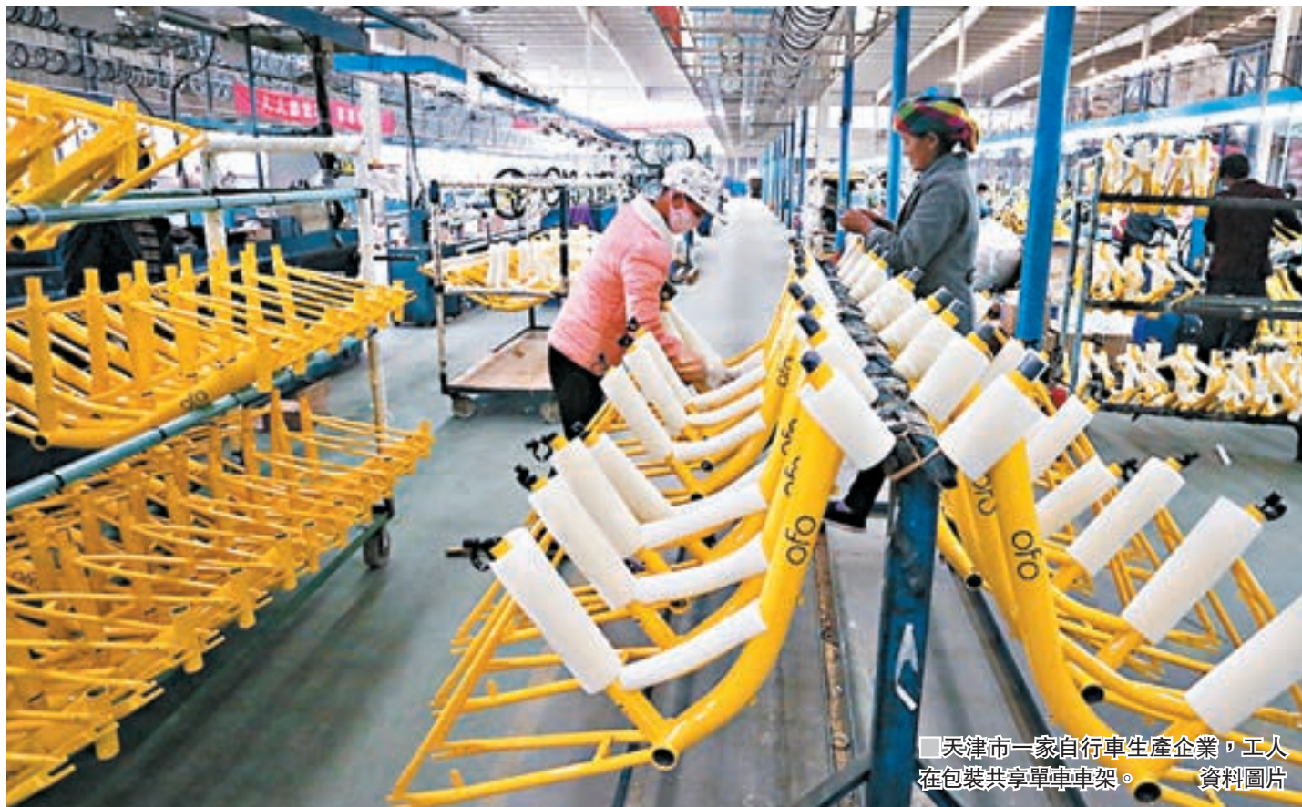
天津市一家自行車生產企業，工人在包裝共享單車車架。

展的指導意見（徵求意見稿）》（《指導意見》），公開徵求意見。《指導意見》要求實行用戶實名制註冊，鼓勵運營企業推行「即租即押、即還即退」模式，並劃設配套的自行車停車點。