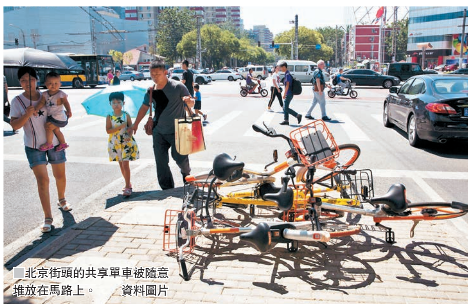
北京街頭的共享單車被隨意堆放在馬路上。

環保人士 ：如果只是在普通平路緩速代步，共享單車是不錯的選擇，其最大好處是毋須回到原點還車，理論上能讓市民作為日常使用的交通工具，或作餘暇的體育活動，符合環保的綠色生活態度。