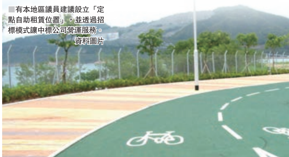
有本地區議員建議設立「定點自助租賃位置」，並透過招標模式讓中標公司營運服務。資料圖片