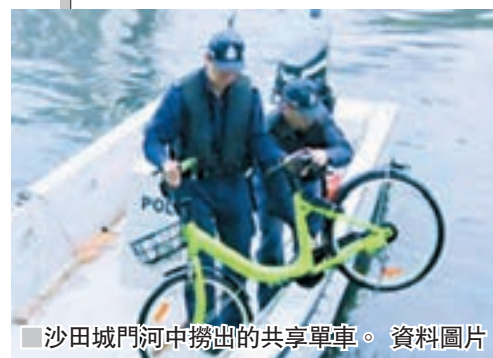
沙田城門河中撈出的共享單車。資料圖片

目前，它在海內外逾100個城市運營超過500萬輛智能單車，日訂單量最高超過2,500萬，註冊用戶逾一億，是全球最大的智能共享單車平台、第一大互聯網出行平台。