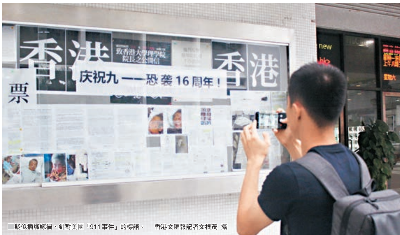
疑似插賊嫁禍、針對美國「911事件」的標語。