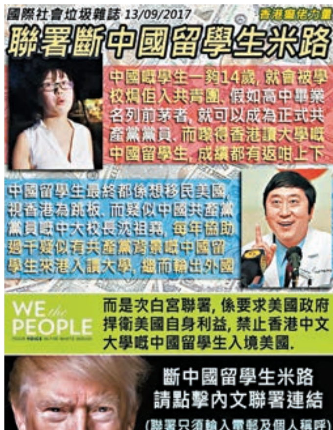
「香港癡佬力量」為白宮聯署「催票」。