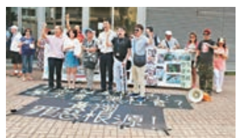
「珍惜群組」一行人到教育局請願。

「珍惜群組」更不齒「港獨」學生的言行，而教協、「支聯會」等以洗腦形式散播仇視國家、政府和警察的