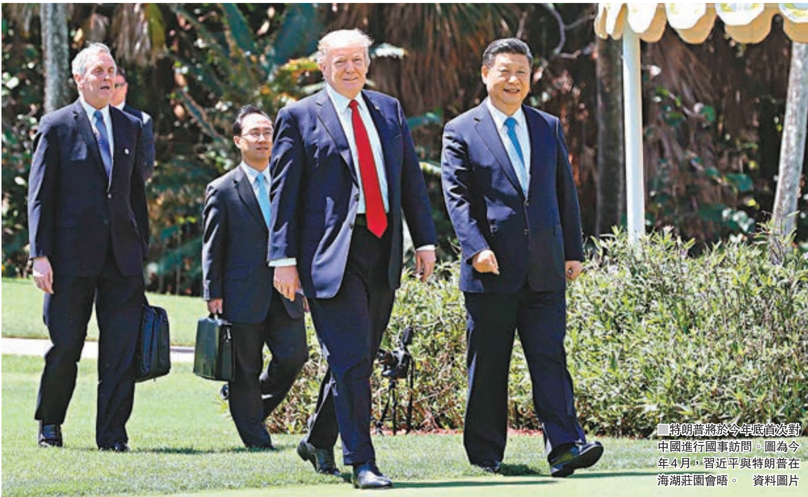
■ 特朗普將於今年年底首次對中國進行國事訪問。圖為今年4月，習近平與特朗普在海湖莊園會晤。資料圖片

香港文匯報訊 (記者 葛沖 北京報道) 應中國國家主席習近平邀請，美國總統特朗普將於今年年底首次對中國進行國事訪問。當地時間12日，訪問牙買加後過境美國華盛頓的國務委員楊潔篪，在與美國國務卿蒂勒森會面時透露了這一消息。楊潔篪表示，中方願與美方共同努力，推動訪問取得積極成果。蒂勒森也表示，特朗普期待同習近平主席共同規劃中美關係未來發展。