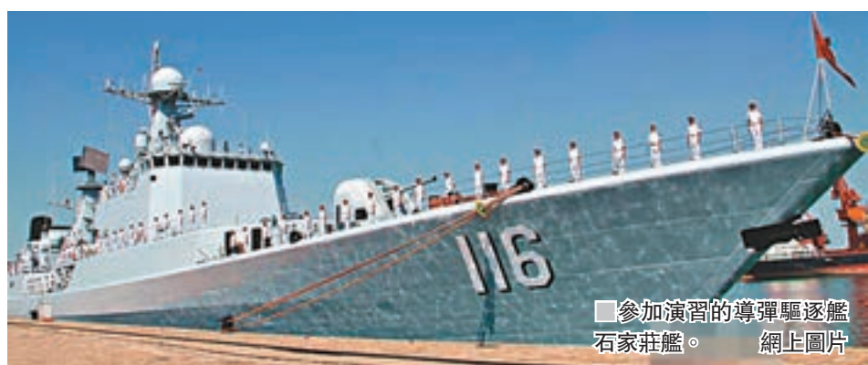
■ 參加演習的導彈驅逐艦石家莊艦。

聯演以聯合救援和保護海上交通線為課題，參演的中國海軍艦艇編隊由導彈驅逐艦石家莊艦、導彈護衛艦大慶艦、綜合補給艦東平湖艦和援潛救生船長島船組成，並攜帶艦載直升機、深潛救生艇、陸戰隊