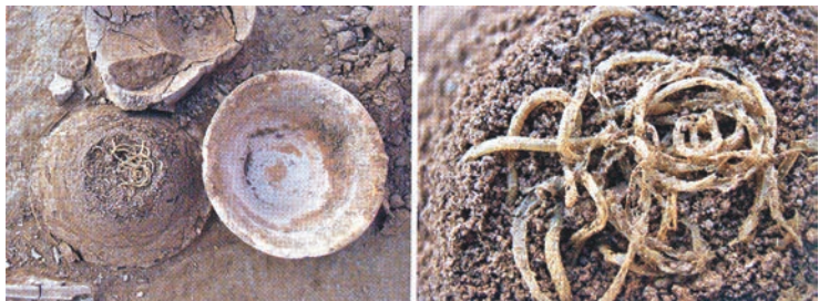
■青海省和縣喇家遺址出土的世界最早的麵條。

圖為青海省和縣喇家遺址出土的世界最早的麵條，屬齊家文化，為西元前2200年至西元前1800年。中國社會科學院考古研究所研究員鞏文表示，概念中西北地區比較落後，實際上在史前時期西北地區要比現在溫暖濕潤一些，人的生活比現在可能要好一些。經科學測試和分析，麵條應為小米做成，而不是小麥，因小麥傳入相對較晚。她補充道，平常在博物館看的文物大多都是精美的玉器或青銅器，而這些麵條則可以幫助我們了解當時普通百姓的生活情況。