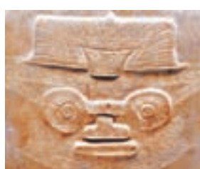
■浙江省餘杭良渚遺址反山墓地出土的大琮，圖為局部放大的神人獸面紋。

圖為餘杭反山墓地出土的被譽為「琮王」的大琮。玉琮呈內圓外方而中帶圓孔的方柱體，以造型奇特、寓意深奧而著稱，是良渚玉器中體積最大、製作最為精緻的一個種類，琮體常等距分為四節，每節四角雕刻有或繁或簡的由獸和神人組成的神人獸面紋。而玉琮上的神人獸面紋是如何做到這麼細緻，至今仍是不解之謎。現在讀者們所看到的圖片是一個放大版本，實際上該紋狀是極之細小，香港中文大學中國文化研究所教授鄧聰表示，這個玉器非常堅硬，而古人可以在上面刻畫出如此細緻的紋狀，是很了不起的。