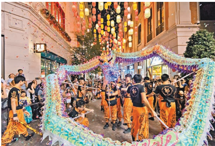
■「LED火龍鼓舞賀中秋」將再度舉行。

灣仔「利東街」為了讓市民度過與眾不同的中秋節，今年將帶來英國藝術家 Luke Jerram 的「月球博物館」，由9月28日至10月31日展示直徑7米的巨型月亮裝置，讓市民無論陰晴，都能在利東街近距離賞月。此外，「利東街」亦帶來了保留香港本土傳統節慶特色的活動，於10月4日及10月5日晚上（即中秋及追月夜兩晚）再度舉行「LED火龍鼓舞賀中秋」，70呎長的LED火龍將穿梭在林蔭步行街上，同日更舉辦富有特色的「大中華非物質文化遺產傳藝會」，期望為市民及旅客獻上豐富的慶祝活動。