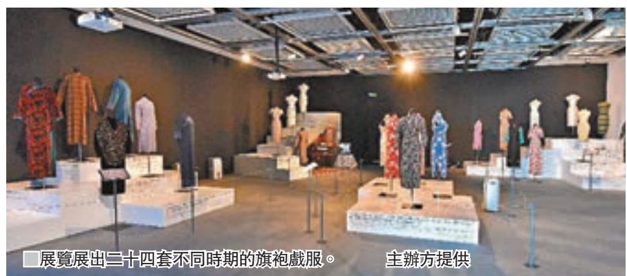
■展覽展出二十四套不同時期的旗袍戲服。主辦方提供

除了傳統與當代藝術的匯合，「利東街」將於中秋節期間舉辦富有特色的「大中華非物質文化遺產傳藝會」。邀請到中國傳統手作專家舉行工作坊，讓市民可參加及製作多款中國傳統藝術，包括燈籠製作、麵粉捏塑、剪紙和繩結。當中，紮作技藝更被納入康文署早前於8月公佈的首份「香港非物質文化遺產代表作名錄」，具有深厚的歷史及工藝價值。傳藝會不僅能豐富節慶氣氛，更能推廣中國傳統文化及傳統技藝，讓更多年輕一代或外國旅客得以了解認識。