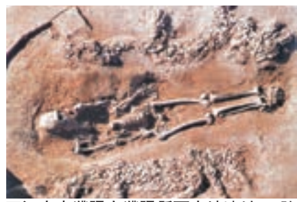
■河南省濮陽縣西水坡遺址45號墓的人骨及一龍一虎。

圖為河南省濮陽縣西水坡遺址45號墓，為仰韶文化，約西元前4500年。人骨兩側由蚌殼擺塑一龍一虎。龍的形象是我國迄今為止發現的時間最早、體形最大、形態最逼真的龍形象，被譽為「中華第一龍」。鞏文表示，這是中國最早的龍的形象，龍發展下去有不同形態，而龍的形象隨着時間的推移也不斷發展中，跟中國人的想像還是有很大的關係。