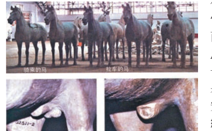
■秦兵馬俑坑出土的馬俑。

圖為陝西省西安市臨潼區秦兵馬俑坑出土的馬俑。相信有的讀者已經去過這個被譽為「世界八大奇蹟」之一的地方，但說實在的，如果自己到該地參觀，隔着遠遠的圍欄，所看到的就僅僅是那些兵馬俑，然而事實上遠遠沒有想像中簡單，圖中的馬俑便是最好的例子。原來騎乘的馬和拉車的馬是有分別的，其分別則在於騎乘的馬是未有閹割的，而拉車的馬，則已被閹割。據介紹，因為兩種不同作用的馬所需的性格不同，例如用作騎乘的馬，可能要行軍打仗，性子當然要烈一些，而用作拉車的馬，性子則溫和一些也無妨。如果讀者自行去西安兵馬俑參觀，絕不會近距離看到如此細緻的部分。