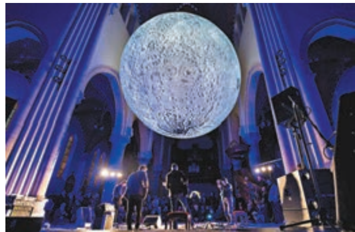
■巨型月亮裝置曾在荷蘭、英國等地巡迴展覽。