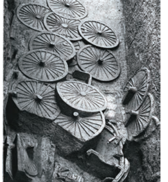
■張家坡西周墓地157號墓南墓道輪轂痕跡。

圖為陝西省西安市臨潼區秦兵馬俑坑出土的馬俑。相信有的讀者已經去過這個被譽為「世界八大奇蹟」之一的地方，但說實在的，如果自己到該地參觀，隔着遠遠的圍欄，所看到的就僅僅是那些兵馬俑，然而事實上遠遠沒有想像中簡單，圖中的馬俑便是最好的例子。原來騎乘的馬和拉車的馬是有分別的，其分別則在於騎乘的馬是未有閹割的，而拉車的馬，則已被閹割。據介紹，因為兩種不同作用的馬所需的性格不同，例如用作騎乘的馬，可能要行軍打仗，性子當然要烈一些，而用作拉車的馬，性子則溫和一些也無妨。如果讀者自行去西安兵馬俑參觀，絕不會近距離看到如此細緻的部分。