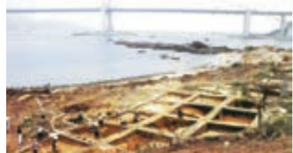
■香港馬灣島東灣仔北遺址發掘情況。

圖為香港馬灣島東灣仔北遺址發掘情況，為西元前3700年至西元前500年，考古學家發現了從史前到青銅器時代三個階段的文化遺存，取得豐碩成果，被評為1997年的「中國十大考古發現」之一。二十座新石器時代晚期至青銅時代早期（約公元前2000至公元前1000年）年墓葬，主要分佈在沙堤內側，似有一定佈局。墓中發現包括陶器及石器的隨葬品。此外在墓葬中保存較好的古代人類遺骸，是香港以至整個珠三角地區的重要考古發現。