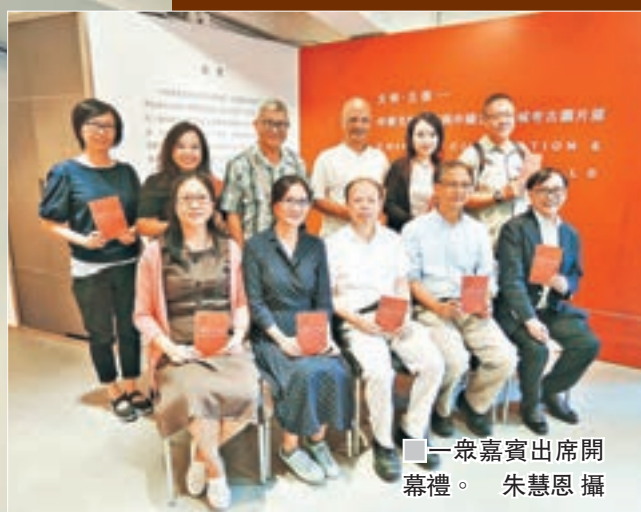
一眾嘉賓出席開幕禮。

在中國五千年的文明史中，祖先在這片遼闊的土地創造了燦爛的文化瑰寶，隨著時代更替，大部分的歷史遺蹟均長埋於黃土下。若要把這些不為人知的歷史再現眼前，考古則扮演重要角色。由香港中國學術研究院主辦、中國社會科學院考古研究所承辦的「文明·古都考古圖片」展即日起至9月20日在中環奧卑利街19號地下舉辦，把考古場面及各種具代表性的文物以圖片方式再現觀眾眼前。資料整理：香港文匯報記者 朱慧恩