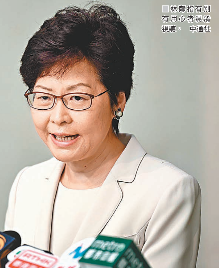
林鄭指有別有用心者混淆視聽。

林鄭月娥日前就「港獨」文宣及針對教育局副局長蔡若蓮喪子的涼薄標語事件發出聲明，嚴厲譴責滋事者。13間大專院校學生會日前發表聯署聲明，抹黑林鄭譴責滋事者的言論是「箝制學生表達自由，企圖向校方施壓，大興文字獄」云云。