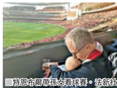
特恩布爾帶孫女看球賽。

澳洲總理特恩布爾周末在社交網上載照片，顯示自己在悉尼一個球場觀看澳式橄欖球賽，其間一手拿着一杯啤酒，一手將孫女抱在懷中並輕吻她的額頭，圖片配上「一心多用」的說明。網民批評特恩布爾不