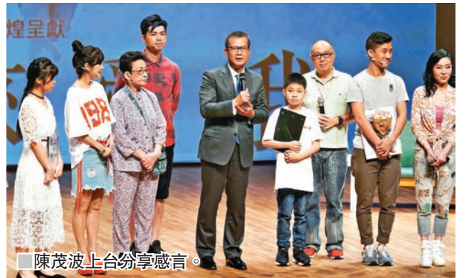
陳茂波上台發表演講。