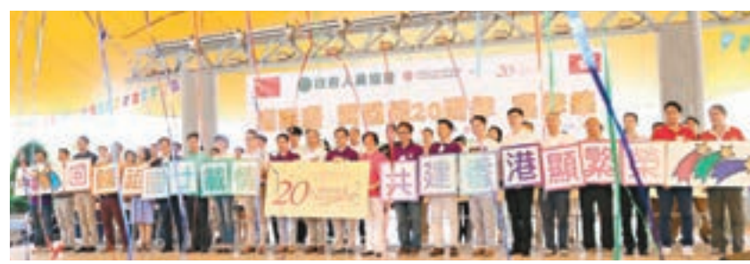
「迎國慶 賀回歸20周年嘉年華」正式啟動。

香港文匯報訊(記者 文森)政府人員協會、工聯會沙田地區服務處及馬鞍山聯絡處,昨日在沙田中央公園結客場共同舉辦「迎國慶 賀回歸20周年嘉年華」,多個政府部門派員出席,加上不少市民到場參與,場面十分熱鬧。眾人一同慶祝香港回歸祖國20周年,完全體現了香港在祖國成功領導推行「一國兩制」下,「同心創前路,掌握新機遇」的精神。