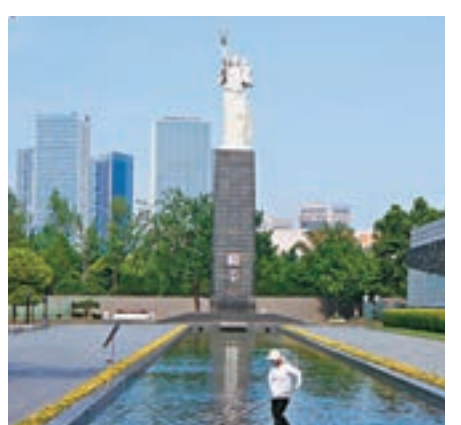
南京獲准成為「國際和平城市」。圖為當地的「和平女神」雕塑。資料圖片

香港文匯報訊 據中新社報道, 侵華日軍南京大屠殺遇難同胞紀念館館長張建軍昨日在南京舉行的「第十六屆歷史認識與東亞和平論壇」上, 宣佈國際和平城市協會(International Cities of Peace)於上月31日正式通過批准南京成為世界第169個「國際和平城市」, 並且是中國首座加入該組織的城市。