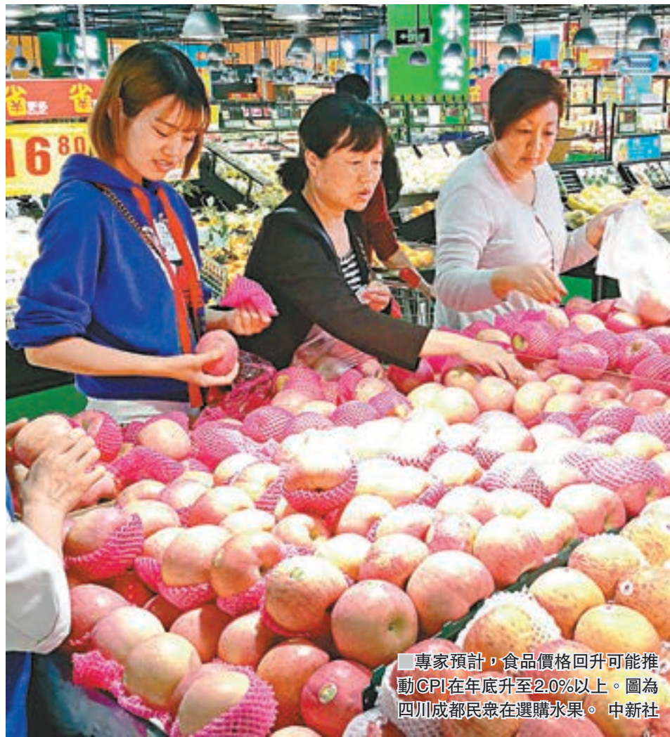
專家預計，食品價格回升可能推動CPI在年底升至2.0%以上。圖為四川成都民眾在選購水果。

香港文匯報訊(記者 海巖 北京報道) 國家統計局昨日公佈, 8月中國居民消費價格指數(CPI)同比上漲1.8%, 漲幅比上月擴大0.4個百分點, 創七個月新高, 為今年次高; 當月工業生產者出廠價格指數(PPI)同比上漲6.3%, 漲幅擴大0.8個百分點, 連續一年同比正增長, 並創四個月新高。專家表示, CPI和PPI雙雙超預期走高, 可能帶動通脹預期上升。總體看物價漲幅仍處低位, 預計年內CPI將維持溫和走勢, PPI到四季度可能因基數較高而出現同比明顯下降。