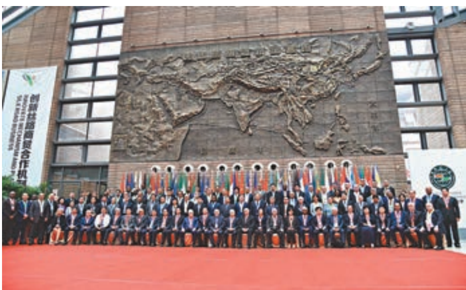
「一帶一路」沿線70餘個國家的代表出席第二屆絲綢之路工商領導人(西安)峰會暨絲綢之路國際文化周。

峰會發來賀信, 她在賀信中指出, 國家「一帶一路」倡議推動國際合作, 促進區域發展, 加強人文交流。香港是「一帶一路」建設的重要節點, 並在「一帶一路」建設中擔當「超級聯繫人」的角色。香港會好好把握「一帶一路」帶來的龐大機遇, 充分發揮「一國兩制」的獨特優勢和自身所長, 協助推動「一帶一路」沿線國家在不同領域深化合作, 為「一帶一路」建設作出貢獻。