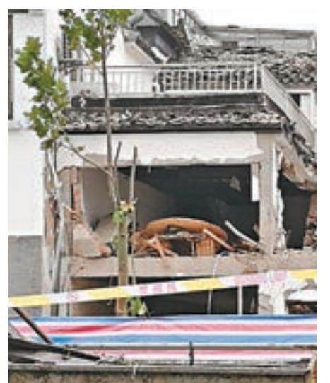
爆炸地點外牆損毀嚴重。網上圖片

香港文匯報訊 據《現代快報》消息, 江蘇省蘇州市姑蘇區人民路北寺塔附近昨日上午發生爆炸, 事故造成1人死亡9人不同程度受傷。爆炸的店面幾近全毀, 消防隊員正在進出清理現場, 門口散落着大量碎石磚瓦木塊。街對面的人行道上, 散落着鋁窗窗框、樹枝以及玻璃碎片。附近一些店面的門牌都被震了下來, 一輛停靠在路邊的車玻璃盡碎。