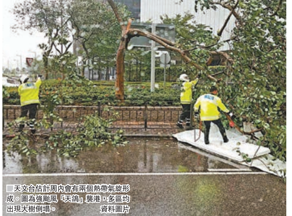
天文台估計周內會有兩個熱帶氣旋形成,圖為強颱風「天鴿」襲港,多區均出現大樹倒塌。資料圖片

香港未來9天天氣預測,均部分時間有陽光及有幾陣驟雨,其中周五更有幾陣雷暴,氣溫介乎27度至33度。