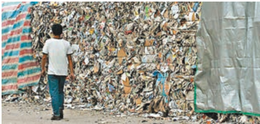
內地造紙廠未能接收本港進口廢紙,疑與部分造紙廠被揭發違法違規,被註銷進口廢紙批文有關。資料圖片

香港文匯報訊(記者 文森)內地將於年底收緊廢料進口政策,大幅提高廢廢料的進口要求。本港有回收業界計劃下周五起停收廢紙。環境局副局長謝展寰昨日回應指,近期內地