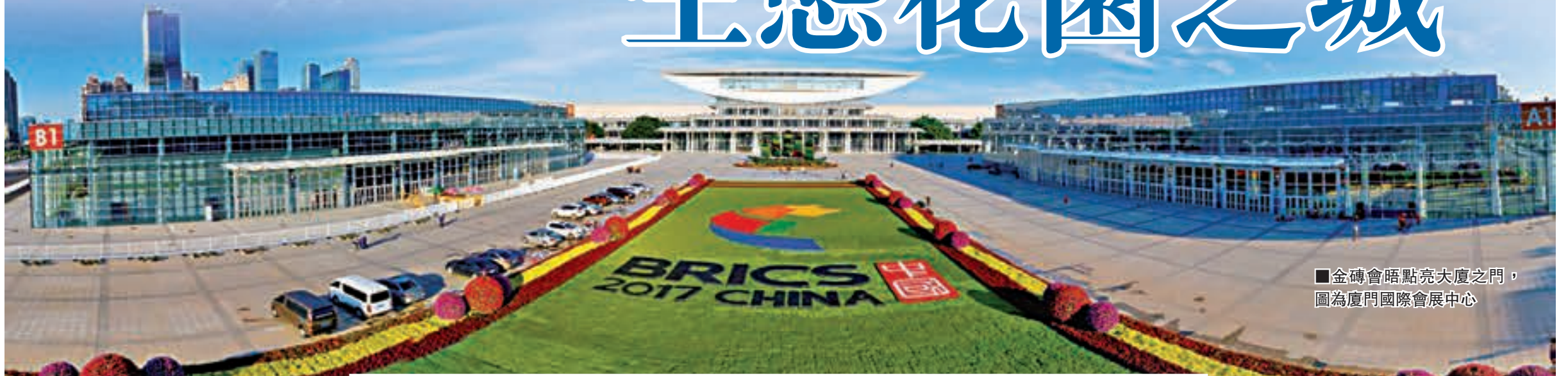
■金磚會晤點亮廈門之門，圖為廈門國際會展中心

9月3日至5日，金磚國家領導人廈門會晤成功舉行。金磚五國領導人會晤，10個新興市場國家和發展中國家展開對話，全球約1000名工商界人士聚首，中國國家主席習近平多次發表講話……共識在溝通中凝聚，方向在擊畫中清晰，巨輪從廈門再出發。