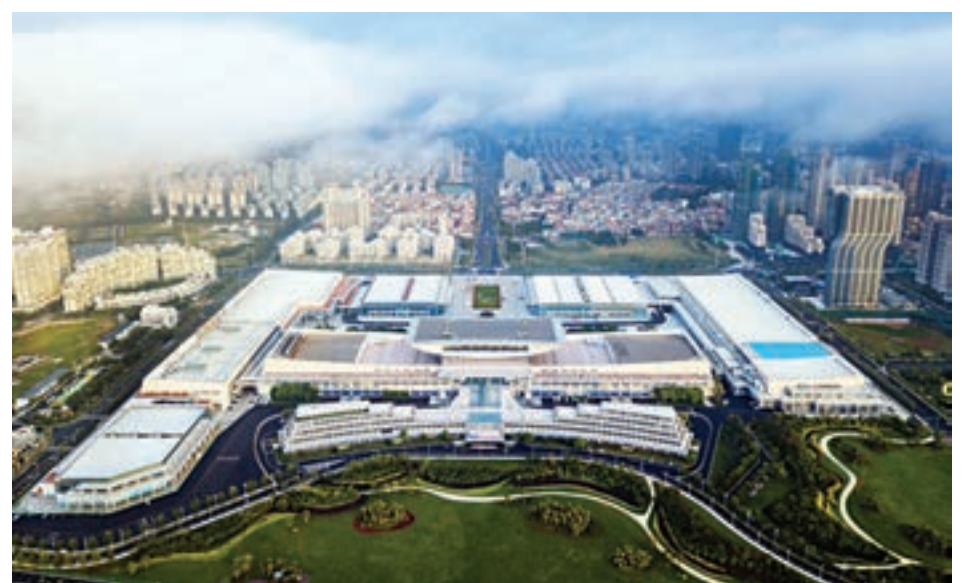
■30多載春風化雨，今天的廈門脫胎換骨、鳳凰涅槃