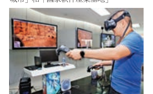
■一位體驗者在廈門吉比特網絡公司展廳體驗虛擬現實設備

據介紹，廈門互聯網基因十分強大。早在十多年前，互聯網剛在中國普及時，廈門就成為互聯網創業的熱土。如今，廈門已成為「中國軟件名城」、「對台服務外包基地城市」和「國家軟件產業基地」。