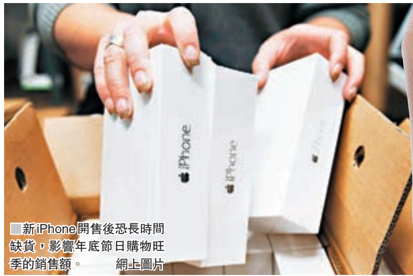
新iPhone開售後恐長時間缺貨，影響年底節日購物旺季的銷售額。

新iPhone據傳將名為iPhone 8或iPhone X，分析師對新iPhone寄望甚殷，預計初期出貨量可多達500萬部，足以扭轉近期持續不振的銷售額。蘋果上月亦預期截至本月30日的最新季度，銷售收益達490億至520億美元(約3,825億至4,059億港元)，超出市場估計。 ■《華爾街日報》