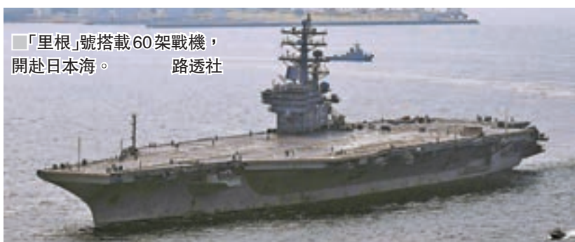
「里根」號搭載60架戰機，開赴日本海。 路透社

美國總統特朗普前日放口風，他表示對朝採取軍事行動當然是選項，但也有其他方式可以解決，美國須仔細審視所有實際情況。 ■美聯社