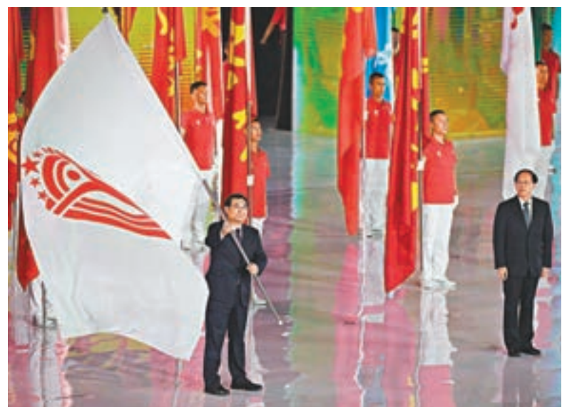
陝西省省長胡和平(前左)接過全運會會旗。