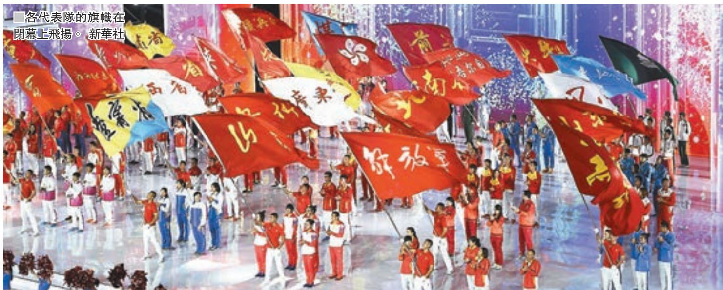
各代表隊的旗幟在閉幕上飛揚。