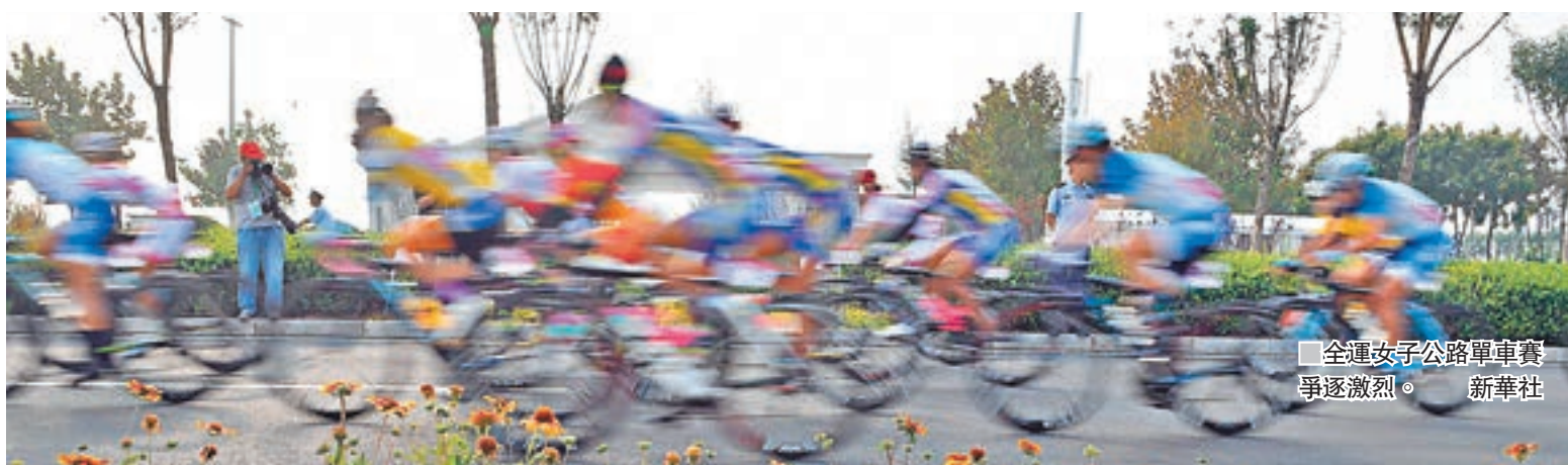
全運女子公路單車賽爭逐激烈。