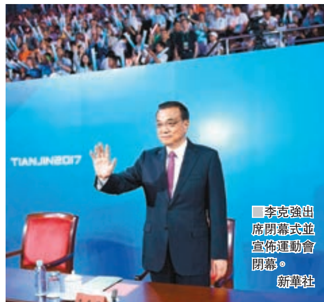
李克強出席閉幕式並宣佈運動會閉幕。