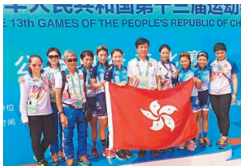
香港單車女隊昨賽後合影。