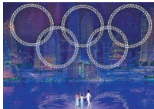
奧運五環完美地呈現在觀眾面前。新華社