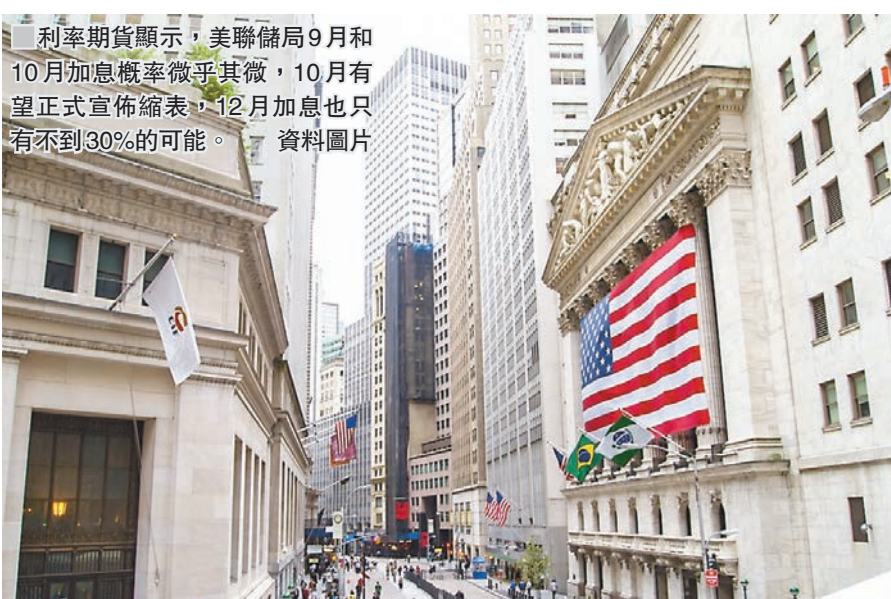
利率期貨顯示，美聯儲局9月和10月加息概率微乎其微，10月有望正式宣佈縮表，12月加息也只有不到30%的可能。 資料圖片

澳元曾短線走低，不過很快反彈。在近一個多月都維持在0.78至0.8上落，呈現V形，但區間阻力不小，有回吐風