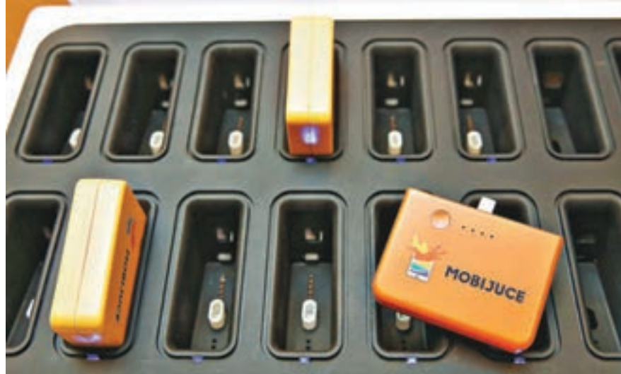
■一個 JuceBox 可存放多個流動電源。