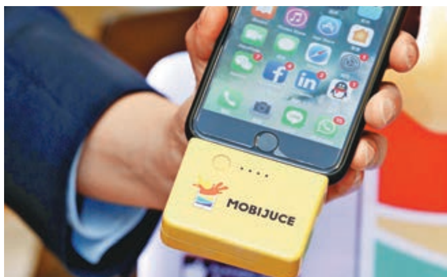
■租用流動電源無須按金，每30分鐘收費2元。