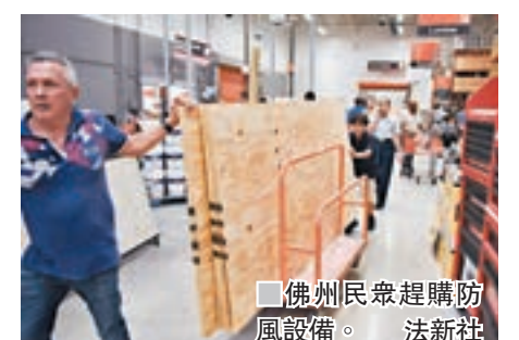
■佛州民眾趕購防風設備。

加勒比海不少島嶼均是歐洲國家屬地，法國和荷蘭政府先後派人前往當地協助，島民則到超市搶購糧水及日用品，航空公司