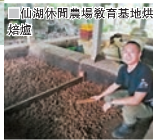
仙湖休閒農場教育基地烘培爐