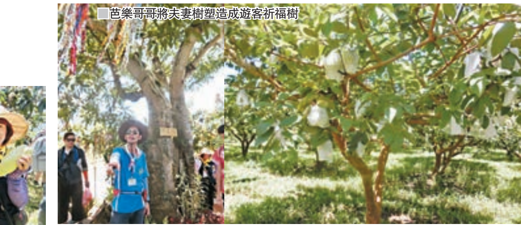
芭樂哥哥將夫妻樹塑造成遊客祈福樹