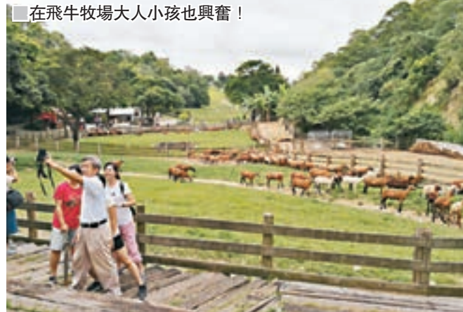
在飛牛牧場大人小孩也興奮！

在苗栗縣，一直以「自然、健康、歡樂」為宗旨的飛牛牧場，牧場內飼養了超過350頭牛隻，並研發多元化的乳製品產品，讓遊客享受大自然之美，同時也可品嚐各種新鮮的牛乳製品。當中以牧場知名的新鮮乳品製作成的優格蛋糕，嚴選台灣純土鳳梨，融合麵粉手工烘培製作，這黃金比例的組合，成就了牧場獨家私房的優格鳳梨蛋糕。舌尖上品味蛋糕的幼細綿滑、鳳梨的濃郁香氣，令人真實感受到牧場烘培坊的特別溫度，每一口都是小確幸的味道，還可以配他們以蝶豆花製的花茶實不錯。