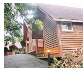
仙湖休閒農場小木屋民宿