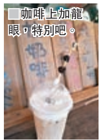
咖啡上加龍眼，特別吧。