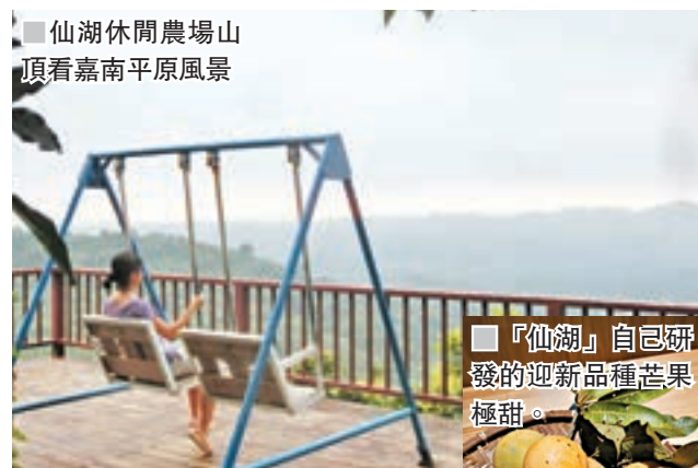
仙湖休閒農場山頂看嘉南平原風景