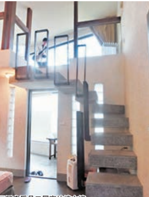
星空房是二層高的樓中樓