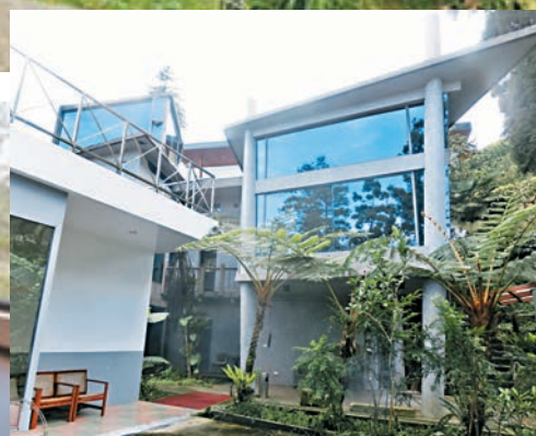
龍雲休閒農場的星空房