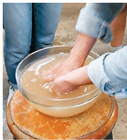
農場千金親自示範製作「愛玉水果冰茶」