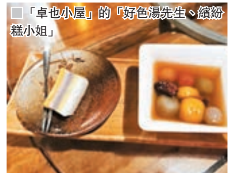
「卓也小屋」的「好色湯先生、繽紛糕小姐」