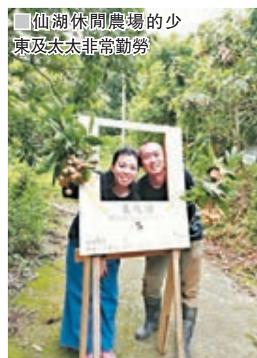
仙湖休閒農場的少東及太太非常勤勞