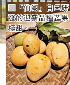
「仙湖」自己研發的迎新品種芒果極甜。