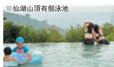
仙湖山頂有個泳池