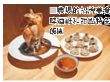
農場的招牌美食啤酒雞和甜點特色飯團