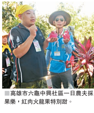
高雄市六龜中興社區一日農夫採果樂，紅肉火龍果特別甜。