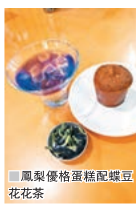
鳳梨優格蛋糕配蝶豆花花茶

在苗栗縣，一直以「自然、健康、歡樂」為宗旨的飛牛牧場，牧場內飼養了超過350頭牛隻，並研發多元化的乳製品產品，讓遊客享受大自然之美，同時也可品嚐各種新鮮的牛乳製品。當中以牧場知名的新鮮乳品製作成的優格蛋糕，嚴選台灣純土鳳梨，融合麵粉手工烘培製作，這黃金比例的組合，成就了牧場獨家私房的優格鳳梨蛋糕。舌尖上品味蛋糕的幼細綿滑、鳳梨的濃郁香氣，令人真實感受到牧場烘培坊的特別溫度，每一口都是小確幸的味道，還可以配他們以蝶豆花製的花茶實不錯。