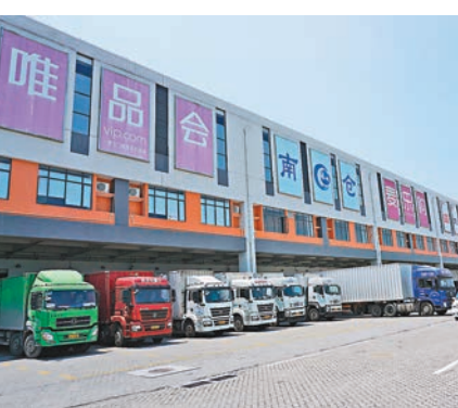
廣州將釋放更多場地資源，降低商事主體經營場所成本。

出了「工業用地先租賃後出讓、彈性年期出讓」的措施，工業用地使用權租賃年限不超過10年，彈性年期出讓的土地使用權出讓年限不超過20年。比起以往工業用地按50年的最高年限進行出讓，且受讓企業須一次性繳納50年土地出讓金的做法，降低了企業成本負擔。 廣州還鼓勵個體工商戶轉型為企業（以下簡稱「個轉企」），支持民營企業併購重組、總部落戶，支持中小微企業發展壯大。為「個轉企」提供工商註冊專人幫辦服務；推動「個轉企」無負擔過渡，對「個轉企」小微企業前5年殘疾人就業保障金和代理記賬費給予補助。