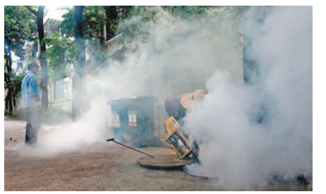
防疫部門正在社區滅殺蚊蟲。

香港文匯報訊（記者 敖敏輝 廣州報道）9月的廣東是登革熱輸入病例和本地流行病例的高發期，香港文匯報記者從廣州白雲機場口岸獲悉，截至8月底，該口岸共檢出41例登革熱陽性病例，較往年大增逾86%。來自廣東省疾控部門數據顯示，至8月底，省內14個地市已報告登革熱病例近180例（無死亡病例），同比上升近四成。專家指出，目前，由登革熱輸入病例引發本地病例的風險不斷加大，廣州、佛山等珠三角地區是高風險傳播區。 來自廣東疾控部門的數據還顯示，在已發現的近180例患者中，非輸入性的本地病例超過70例，其中，廣州患者數量高居榜首，佛山病例亦在2位數以上。專家指出，廣東與登革熱疫情高發流行的東南亞、南美等地商貿、旅遊往來頻繁，且近期監測顯示全省蚊媒密度呈上升趨勢，全省發生登革熱疫情傳播擴散風險進一步升高。