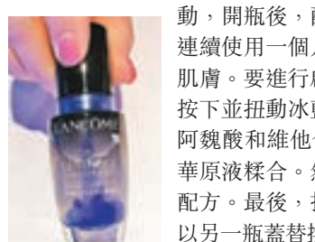
開封後，精華原液釋放出來。

嫩肌活膚雙精華 (HK$630/20ml) 讓女性可隨心所欲，在有需要時才啟動護膚療程。只需按一下，雙精華瞬間啟動，開瓶後，配方可保鮮兩個月，精華液連續使用一個月能長效鎮靜、平衡及修復肌膚。要進行啟動，三個步驟即可。首先按下並扭動冰藍精華瓶蓋，令在瓶蓋中的阿魏酸和維他命 E，與玻璃瓶中的高效精華原液糅合。然後，搖動瓶身，均勻混合配方。最後，扔掉清空的冰藍精華瓶蓋並以另一瓶蓋替換。