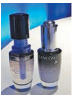
(左)未開封;(右)開封後

世界瞬息萬變，生活模式忙亂，身心每刻轉變，肌膚作為首道防線，特別容易出現多變反應，擾亂皮膚生態而變得脆弱。肌膚會傳送女性感覺到的訊號，如暗粒、泛紅、繃緊、暗啞等。有見及此，Lancôme 首創高效精華原液 Soothing Probiotic Fraction，透過嶄新生物科技過程提取，成就更純粹的萃取得，修護肌膚。配方確保成分深入滲透至皮膚底層，有效擊退炎症，鎮靜肌膚，同時改善肌膚表層結構和異常變化，鞏固肌膚屏障，締造水潤緊緻的肌膚。