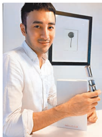
美容產品——H3O 氫離子多功能精華儀。

一直以來，IPM 致力研發美容產品，品牌曾於韓國生產的 H3O 氫離子能量棒可製出 H3O 氫離子水，其可快速清除惡性自由基、阻止自由基破壞細胞、有效防止衰老、皮膚老化等問題的功能，甫推出已深受業界、用家的注目及喜愛，並且獲得香港醫學會認可產品，准予使用「香港醫學會認可」標籤。繼能量棒後，品牌最近成功研發出另一