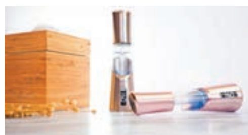
精華儀有兩種顏色選擇。

而且，精華儀還配備三種不同的配頭：滾珠、噴霧及唧嘴，滾珠適合用於面霜及乳液類；噴霧適合用於水狀精華液；唧嘴則用於面霜乳液類。同時，它分別有「女神粉紅」及「貴族金」兩款顏色選擇，加上外形輕巧，不會佔據化妝枱大面積位置，外出亦方便攜帶，現可在網上購買。