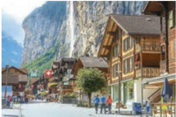
瑞士聯邦經濟總局表示，第二季經濟按年只增長0.3%，只及第一季增長的一半。