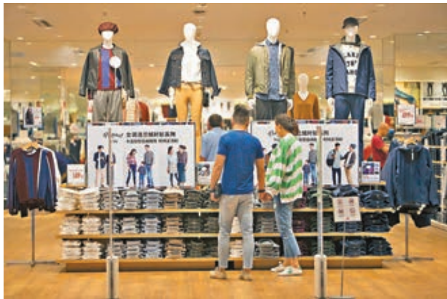
8月財新服務業PMI結束連續兩個月環比下降態勢，升至三個月高位。

就業指數和經營預期指數均回升，前者更創下四個月高點。不過，由於市場競爭加劇，服務業企業的收費價格在17個月以來首次出現下降，且為近兩年低點，而投入成本進一步上揚，升幅不大。