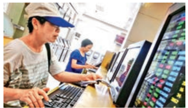
滬綜指成功點穩3,300點關口，反映市場中線有轉暖的態勢。中新社

分析師指出，大盤繼續震盪緩升，金融地產權重股整體走強對指數拉動作用明顯。但目前股指處於相對高位，短期上漲節奏開始放緩，板塊輪動節奏較快，料後市將維持慢牛態勢。