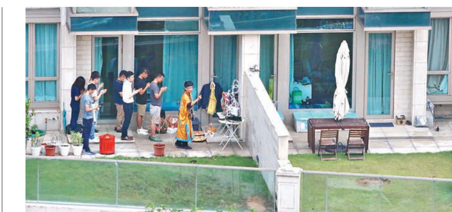
公僕夫婦多名親友昨到墮樓命案現場拜祭。