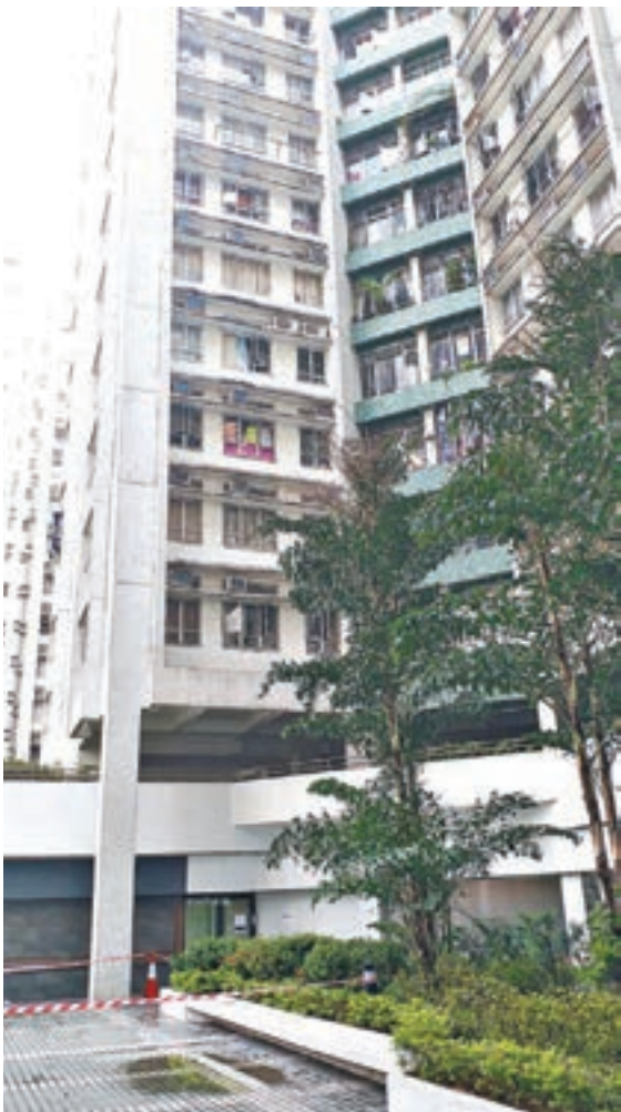
死者懷疑抹窗墮樓，跌在地下平台的花槽上身亡。

在抹窗時，最好是關上窗花，切勿倚着窗花或玻璃工作；若窗戶沒有安裝窗花，則必須「伸手不伸人」的腳踏實地站在地上進行清潔，並使用適當的長柄工具協助，切勿將上半身伸出窗外，避免因失重心發生墮樓意外。