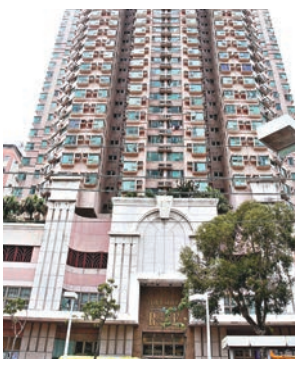
16歲中五生被發現死在屯門玫瑰花園寓所墮樓身亡。

2015年他夥拍同學代表學校參加港燈舉辦的「綠色能源夢成真」賽事，以酒樓點心手推車開發出一台「便攜式能源教室」奪冠；同年他與同學又發明醒日手杖，代表學