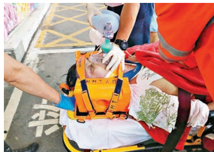
男子疑抹窗窗外墮樓，送院搶救終不治。