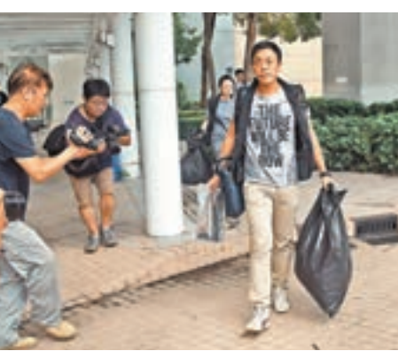
重案組探員到殮房跟進驗屍，並檢走一批證物。

香港終審法院基於近日就另一宗亂刀殺人上訴得直的案例而給予上訴許可，昨日雙方律師陳詞後，終審法院決定撤銷其定罪和刑罰，並批准第三度重審。