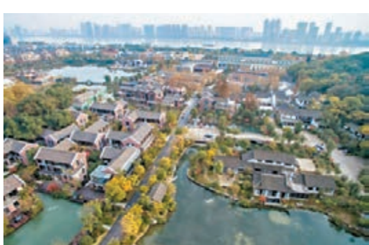
杭州玉皇山南小鎮自發展成為基金小鎮後，大量基金公司迅即聚攏。

特色小鎮創新之處在於可以使地方政府的收入從依賴土地財政向稅收財政進行轉變，如杭州的玉皇山南小鎮，它曾是一個默默無名的城中村，內裡充滿破舊廠房、老式住宅等。但自建成為基金小鎮