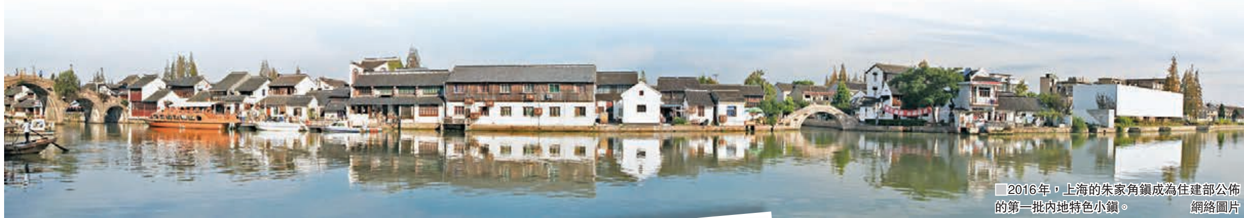
2016年，上海的朱家角鎮成為住建部公佈的第一批內地特色小鎮。網絡圖片

政策紅利疊加資本風口，使得特色小鎮近期在內地開展得如火如荼。據不完全統計，目前有幾十家房地產搶灘特色小鎮，數百個項目集體開工，機構預計其投資市場將達5萬億元（人民幣，下同）規模。專家指，吸引開發商入局小鎮的因素包括政府補貼、低價甚至零成本拿地等。部分特色小鎮已經出現產業未成形、房價已經漲起來的苗頭，引發越來越多聲音呼籲建設小鎮需防止開發商變相圈地蓋樓賣房。