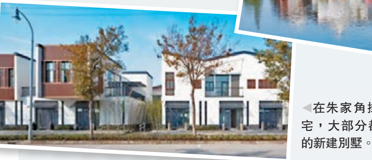
在朱家角掛牌出售的住宅，大部分都是所費不菲的新建別墅。