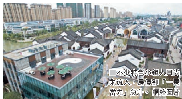
不少特色小鎮人口尚未流入，房價卻「一馬當先」急升。

記者日前查詢上海朱家角特色小鎮房產，發現在中介處掛牌的都是2,000萬元一套的別墅居多。這也使得許多無力買房一族更是哀歎連連，稱原本只是買不起城市的房，現在連環城小鎮的郊區房也買不起了。