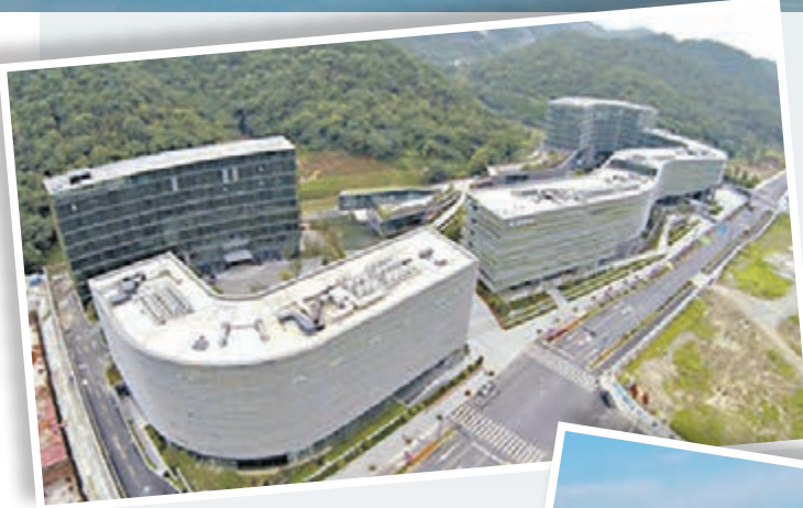
杭州雲棲小鎮在2014年首次被提及，是最早的特色小鎮之一。

對於小鎮項目中出現的地產化傾向，不少開發商認為，因為小鎮屬於「重中之重」的資產項目，目前能看得到的收益也只有房地產是小鎮的重要創收手段，一旦拋棄掉重資產，還真不知輕資產化路線要如何走好。