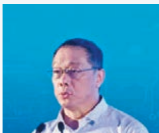
▶李鐵指房企以特色小鎮為名，塑造新的房地產空間。