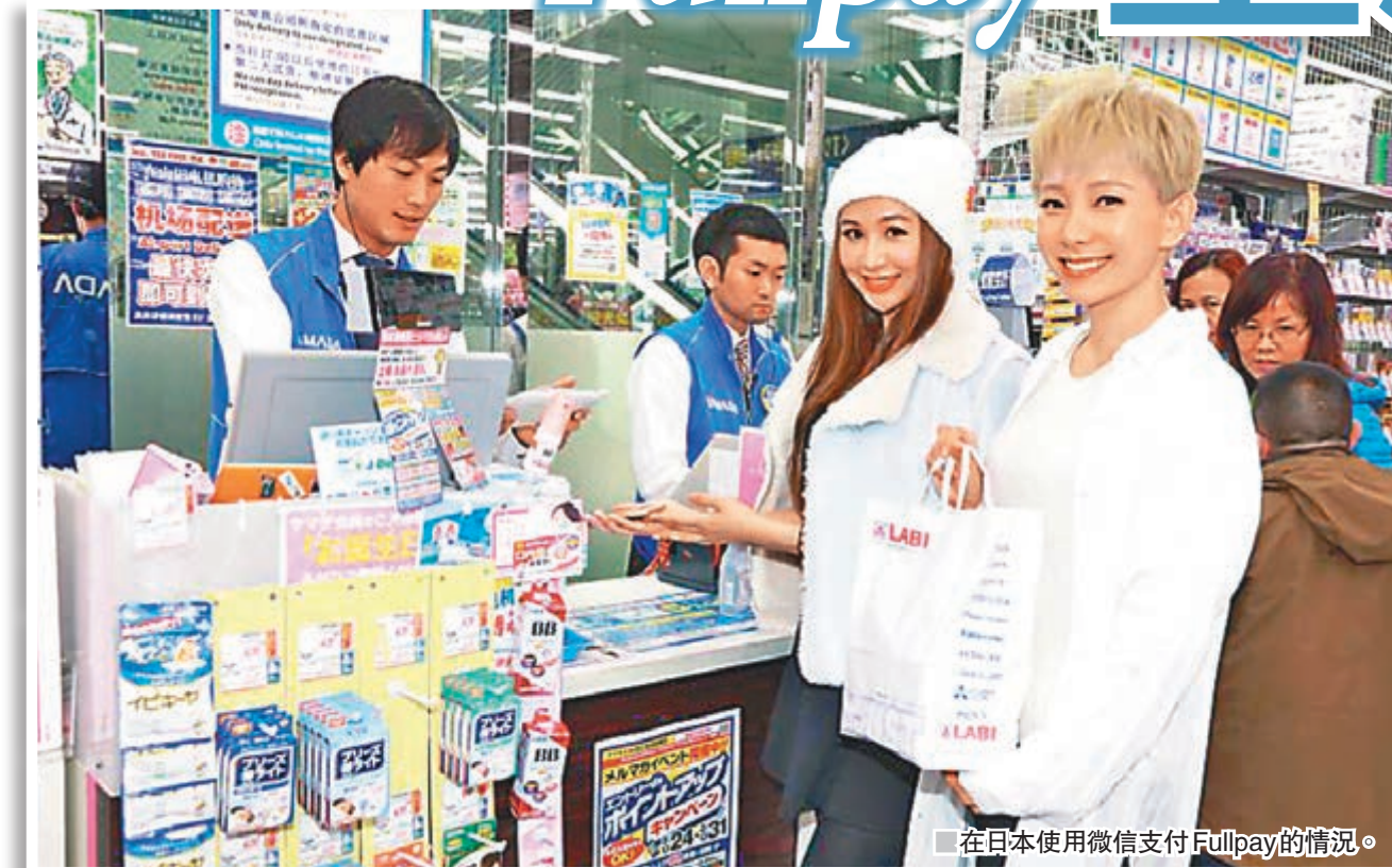
在日本使用微信支付 Fullpay 的情況。

微信支付日本代理商之一「Fullpay 株式會社」今年才成立,目前於日本約有 100 家合作商戶。董波上周接受香港文匯報訪問時稱,期望可於一年內增至 1,000 家合作商戶的目標不變,並繼續從大型商戶入手,如高島屋、近鐵百貨、三越伊勢丹、福岡機場、三田電機等,剛剛又簽約了銀座區的三陽商社,而 10 月 Fullpay 也將落戶成田機場。他透露,Fullpay 已經錄得盈利,進度較之前預期的更快。