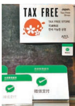
不少商戶已接受使用 Fullpay 付款。

員,在日本各地搜羅內地旅客的熱門消費點。日本一直予人較為保守的形象,在支付方面,首要使用西瓜、Pismo 等 IC 卡,其次是信用卡與現金,手機支付包括 Line Pay、Apple Pay 均極少人使用。