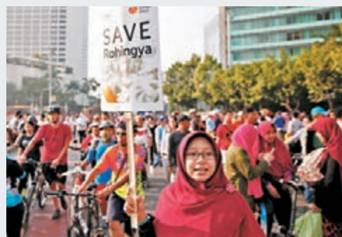
印尼民衆發起遊行，聲援羅興亞人。

根據聯合國前秘書長安南最近發表的報告，羅興亞人是全球最大的「無國籍」種族，大多信奉伊斯蘭教，在以佛教為主的緬甸長期受壓迫，部分羅興亞人組成武裝組織「若開羅興亞救世軍」(ASRA)，以若開邦北部為根據地，武力對抗政府，矢志奪回羅興亞人應有權利，上月底更在若開邦發動連串針對保安部隊的襲擊，引發暴力衝突，有組織成員揚言對抗到底，「不是你死，便是我亡」。