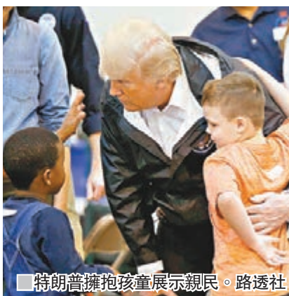
特朗普擁抱孩童展示親民。

得州州長阿博特昨稱，「哈維」造成的經濟損失估計高達1,800億美元(約1.4萬億港元)，是總統特朗普上周末要求國會撥款賑