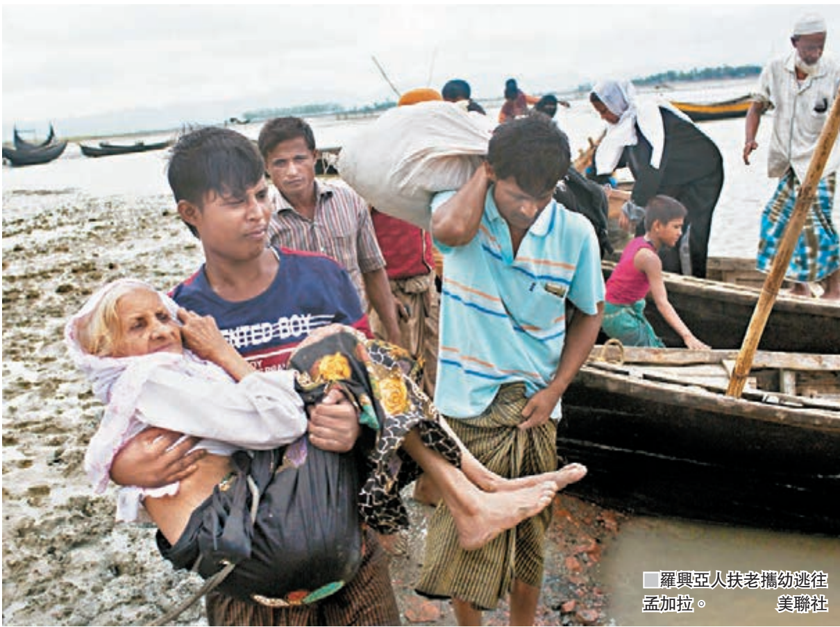
羅興亞人扶老攜幼逃往孟加拉。

羅興亞穆斯林武裝分子上月突襲若開邦30個警崗及基地，與政府軍爆發暴力衝突。鑑於若開邦人道情況惡化，死傷人數不斷上