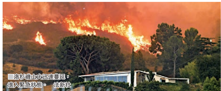
洛杉磯山火迅速蔓延，進入緊急狀態。

美國西岸遭受熱浪侵襲，洛杉磯氣溫達攝氏38度，酷熱天氣引發山火，焚燒面積超過2,000公頃，市長加切蒂前日形容這是洛杉磯歷來最大規模山火，宣佈該市進入緊急狀態，當局已疏散逾700個家庭。