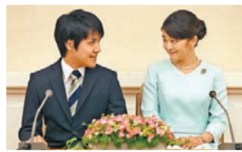
真子公主與小室圭訂婚。

日本宮內廳昨日正式宣佈，日皇二王子秋篠宮夫婦長女真子公主與大學同學小室圭訂婚。日本放送協會報導，王室上午在皇居內根據傳統儀式，舉行日皇准許結婚的「裁可」等儀式，宮內廳長官山本信一郎隨後在廳舍內舉行記者會，公佈訂婚消息。