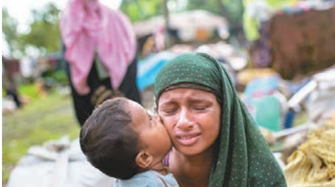
羅興亞兒童親吻哭泣的母親，場面感人。