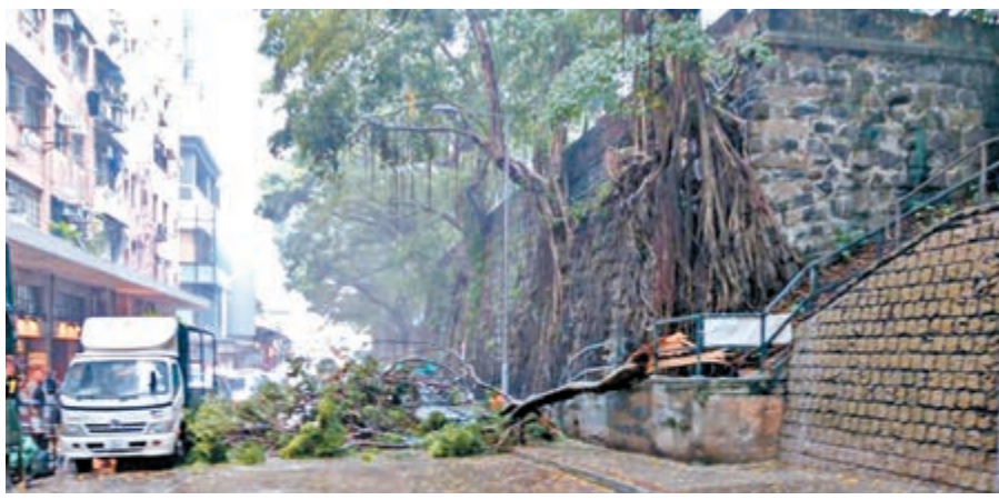
石牆大樹樹幹折斷橫亘路中,壓中路旁車輛。 米高、直徑0.5米的石牆樹,其中一截逾10米長的樹幹突然折斷墜下,壓中兩部停泊路旁的私家車及客貨車,並橫亘行人路及行車線。