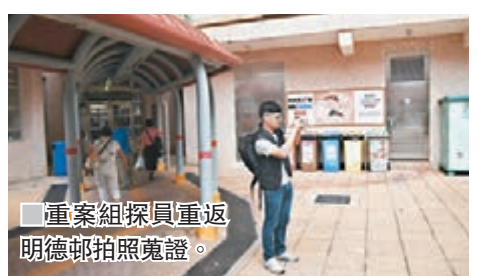
重案組探員重返明德邨拍照蒐證。

「官官相衛」。 工會指,員工表現評核直接影響員工續約和升職,但評核沒有一致準則,要求醫管局正視問題,並確立工會代表權,容許工會代表陪同員工出席申訴會議,協助員工發言及提問。 醫管局昨日回應時稱,十分重視員工的工作表現,亦設有既定客觀的準則,公平公正評核員工表現,醫管局非常關注員工對工作的意見,設有不同渠道讓員工如實反映,對任何投訴事項均會認真處理,亦會向有關員工清楚交代。 醫管局將聯絡有關團體,嚴肅跟進所提及的個案。