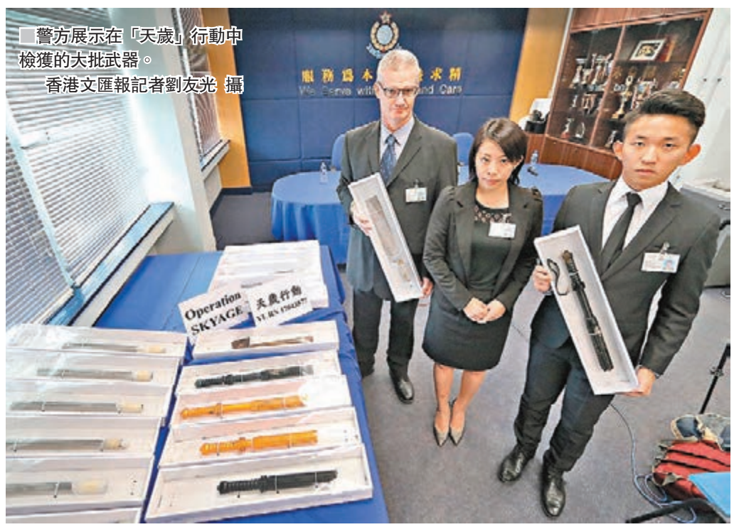
警方展示在「天歲」行動中檢獲的大批武器。

另外,根據記錄,元朗警區今年上半年共拘捕169名干犯刑事罪行的非華裔者,相對去年同期的193名有所下降,但因整體罪案數字持續下跌,非華裔者所佔整體被捕人數百分比,仍由去年的14%,增至今年的15.6%,警方稱會調配資源針對處理。