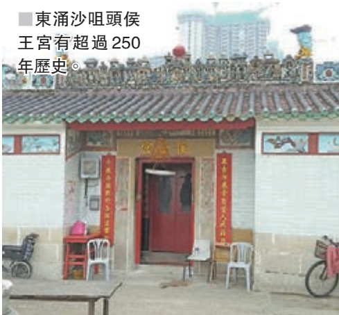
東涌沙咀頭侯王宮有超過250年歷史。