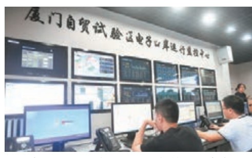
金磚國家擬建一個電子口岸網絡。圖為廈門自貿試驗區電子口岸運行監控中心。

這些交流包括口岸的信息技術應用、口岸與口岸之間是否實現數據的電子交換、貿易數據的貢獻、口岸在為進出口企業提供單一的窗口方面提供哪些做法、有沒有最佳的實踐等等方面。這個示範性的電子口岸網絡,還要請海關、航運等相關專家舉辦一些培訓班。目前中國已在上海建立了14個亞太示範電子口岸,廈門港也是成員之一。廈門計劃在本月舉辦這一