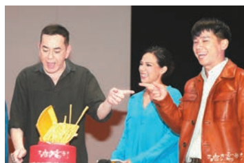
黃秋生(左)牛一，獲贈「金飯盒」蛋糕。