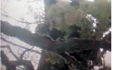
四川瓦屋山團山山片區拍攝到野生大熊貓在樹上呼呼大睡。