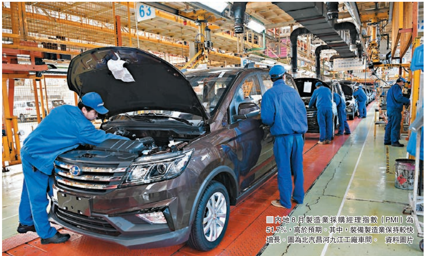
內地8月製造業採購經理指數(PMI)為51.7%,高於預期。其中,裝備製造業保持較快增長。圖為北汽昌河九江工廠車間。

國家統計局服務業調查中心高級統計師趙慶河表示,供需雙雙繼續改善,生產指數和新訂單指數為54.1%和53.1%,分別比上月上升0.6和0.3個百分點。在國內市場向好的帶動下,進口穩中有升,進口指數為51.4%,比上月上升0.3個百分點,為年內高點。