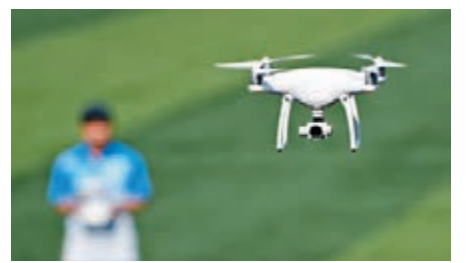
市民在操控無人機進行拍攝。

香港文匯報訊 據新華社報道,經中國民用航空華東地區管理局批准,內地首個民用無人機試飛運行基地昨日在上海啟用。