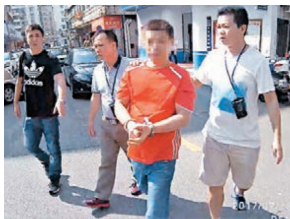
廣東警方在全國10餘個省份同步開展「颶風30號」專案收網行動,成功抓獲198名重大逃犯。圖為一名重案犯落網。

香港文匯報訊(記者敖敏輝廣州報道)廣東警方近日組織大批警力加強對重案嫌疑人的追逃。香港文匯報記者昨日從廣東省公安廳獲悉,近一個月,廣東警方在全國10餘個省份同步開展「颶風30號」專案收網行動,成功抓獲198名重大逃犯,包括23名潛逃多年的命案逃犯,以及175名故意傷害、搶劫、盜竊、電信詐騙等案件逃犯悉數到案。落網嫌疑人當中,逃亡時間在10年以上的達30多人。同時,粵港警方緊密協作,追捕逃往內地的港籍嫌疑人,目前已經鎖定期最新潛入內地的4名要案嫌犯。