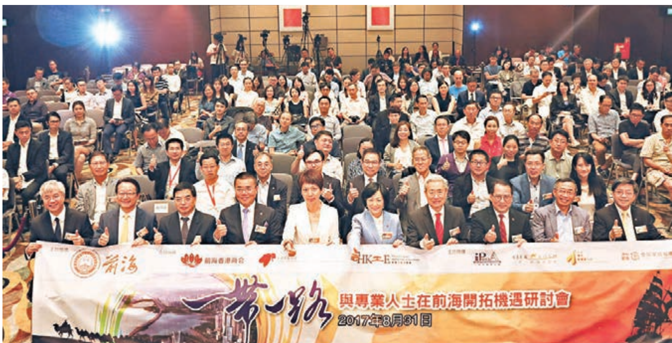
200餘名各界別專業人士出席研討會。