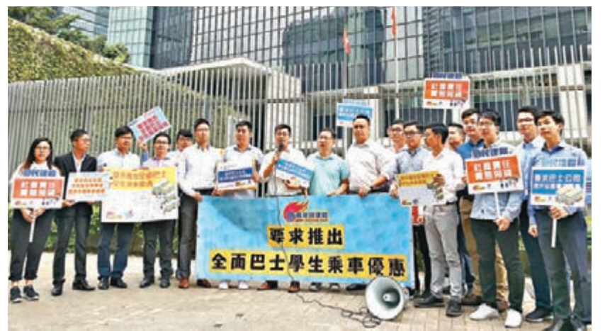
青年民建聯昨日在政府總部請願,要求巴士公司提供全面學生乘車優惠。

青年民建聯認為,企業在社會責任和利潤之間是可以取得平衡的,如巴士公司能為學生提供財政上的援助,一方面能助公司樹立企業社會形象,另一方面在經濟效益的角度亦能吸引更多學生使用巴士作為出行選擇,希望巴士公司能考慮其建議。