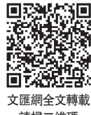
文匯網全文轉載 請掃二維碼

新華社指出，習近平總書記的重要講話系統總結回顧了改革開放近40年來，特別是黨的十八大以來，中國反貧困鬥爭取得的重大成就和成功經驗，全面分析了當前脫貧攻堅工作面臨的形勢和任務，深刻剖析了深度貧困的主要成因，明確了精準脫貧的基本方略，指明了打贏脫貧攻堅戰的方法論、關鍵點、突破口和需要把握的問題。這篇重要講話的發表，對於深入學習領會、認真貫徹落實習近平總書記關於脫貧攻堅的重要戰略思想，確保如期實現全面建成小康社會奮鬥目標具有重要指導意義。