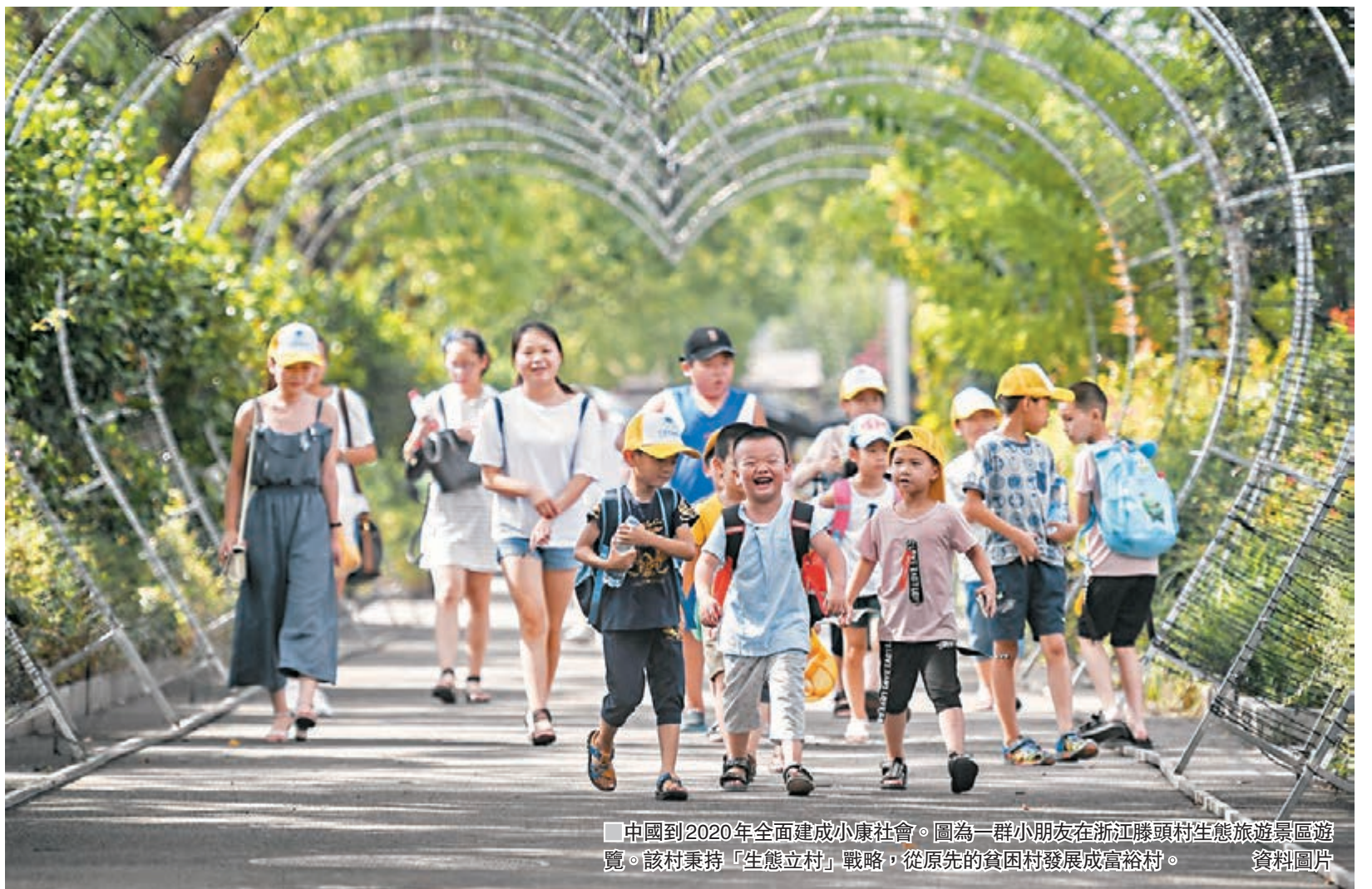
■中國到2020年全面建成小康社會。圖為一群小朋友在浙江滕頭村生態旅遊景區遊覽。該村秉持「生態立村」戰略，從原先的貧困村發展成富裕村。資料圖片