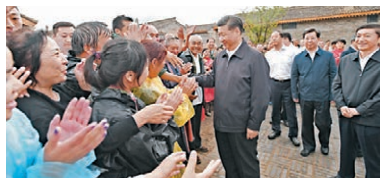
■習近平今年6月在山西忻州市崞嵐縣易地扶貧搬遷集中安置點宋家溝新村看望群眾。資料圖片