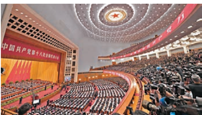
■中共第十九次全國代表大會將於10月18日在北京召開。圖為2012年中共十八大會場。資料圖片

習近平並在講話中指出，全面從嚴治黨永遠在路上。一個政黨，一個政權，其前途命運取決於人心向背。對黨的十八大以來全面從嚴治黨取得的成果，人民群眾給予了很高評價，成績值得充分肯定，經驗值得深入總結。但是，我們決不能因此而沾沾自喜、盲目樂觀。全面從嚴治黨依然任重道遠。全黨要堅持問題導向，保持戰略定力，推動全面從嚴治黨向縱深發展，把全面從嚴治黨的思路舉措搞得更科學、更嚴密、更有效，確保黨始終同人民想在一起、幹在一起，引領承載着中國人民偉大夢想的航船破浪前進，勝利駛向光輝的彼岸。