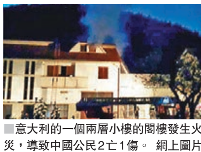
意大利的一個兩層小樓的閣樓發生火災，導致中國公民2亡1傷。

香港文匯報訊 據海外網引述《歐洲華人報》消息，當地時間26日凌晨5點左右，位於意大利普拉托市威亞諾鎮（VAIANO）的一個兩層小樓的閣樓發生火災，造成1男1女兩名中國公民死亡，另1名中國公民受傷。中國駐佛羅倫薩總領館27日發安全提醒，表示希望警方盡快查明火災原因。