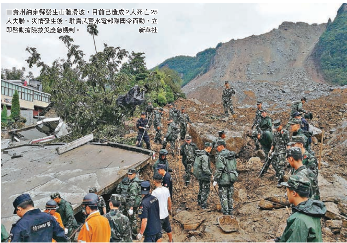
■貴州納雍縣發生山體滑坡，目前已造成2人死亡25人失聯。災情發生後，駐貴武警水電部隊聞令而動，立即啟動搶險救災應急機制。 新華社

香港文匯報訊 綜合《人民日報》客戶端、新華社、中新社及《解放軍報》報道，昨日10時40分許，貴州省畢節納雍縣發生山體滑坡，截至晚間22時，已經救出10人，其中3人死亡，7人受傷；尚有32人失聯。目前已有兩千餘人的救援力量在現場救援。