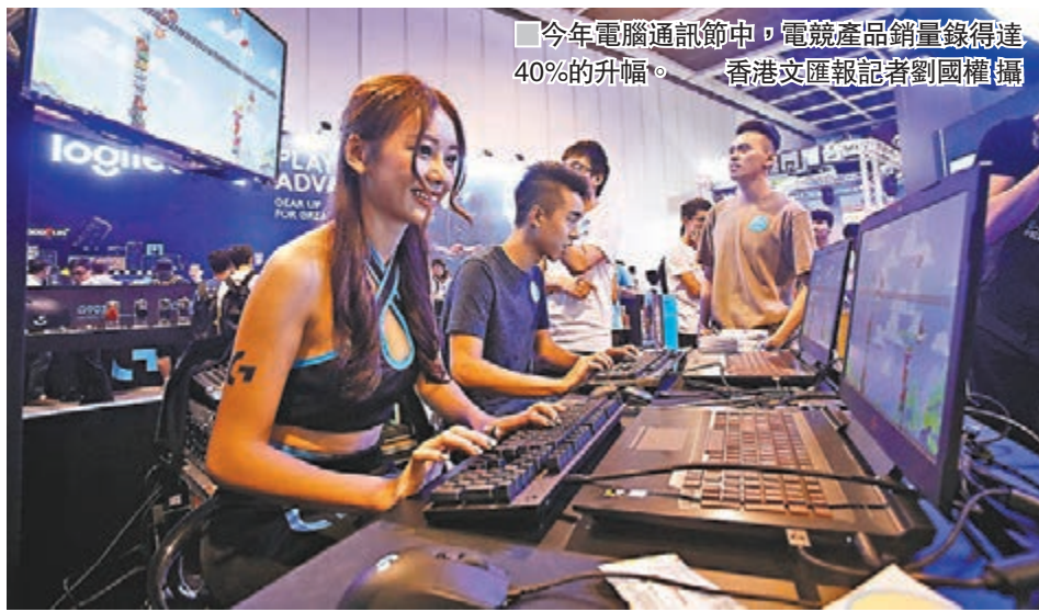
今年電腦通訊節中，電競產品銷量錄得達40%的升幅。

除了電子產品外，電競專用椅等其他相關周邊產品的銷情也不俗。亞萃電子競技創辦人侯澤勳表示，今次是第一年參展，直言對人流及銷售成績感滿意，「雖然這也是意料之內，但公眾對宣傳活動的反應卻予人驚喜，例如在拍賣活動上，一張有職業電競選手親筆簽名的專用椅能以1萬元高價成交。」