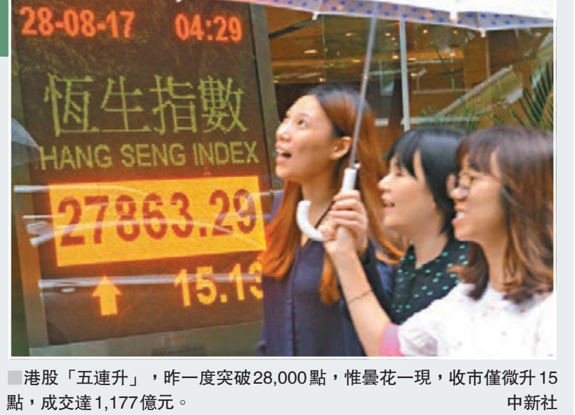
■ 港股「五連升」, 昨一度突破28,000點, 惟曇花一現, 收市僅微升15點, 成交達1,177億元。