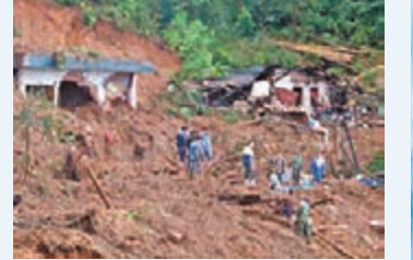
雲南山泥傾瀉現場。

香港文匯報訊 據央視網報道,受颱風「天鴿」影響,雲南紅河金平縣境內26日凌晨發生泥石流災害,直至截稿前,確認一人已經遇難,6人失聯,當地11戶民房損毀。