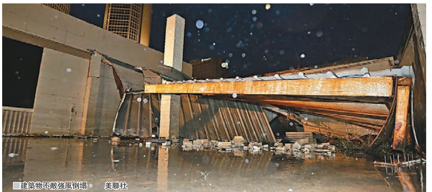
建築物不敵強風倒塌。