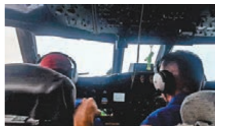
「颶風獵人」闖風眼，能見度近乎零。

「颶風獵人」由P-3「獵戶座」海上巡邏機改裝而成，機上配備特殊雷達和氣象觀測設備，但機身並無因應颶風而特別強化，與一般海上巡邏機無異，因