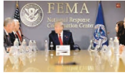
特朗普到聯邦緊急事故管理署開會。

當「哈維」上週中增強為颶風後，華府官員已經頻頻出動，特朗普除了透過twitter呼籲小心打風外，亦一直與得州和路易斯安那州的州長保持聯絡，又在twitter上載他聽取聯邦緊急事故管理署