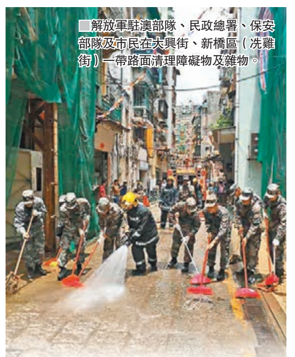
解放軍駐澳部隊、民政總署、保安部隊及市民在大興街、新橋區(洗雞街)一帶路面清理障礙物及雜物。