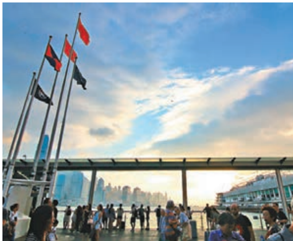
三號強風信號昨晚8時40分發出,尖沙咀五支旗已被吹起,今日風勢會逐漸增強。

香港民政事務總署昨晚表示,因應天文台已發出3號熱帶氣旋警告信號,該署已設立一條24小時緊急事故熱線2835-1473供市民查詢有關消息。