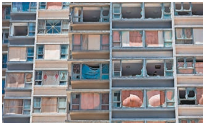
澳門一座豪宅的玻璃窗和玻璃幕牆被「天鴿」吹毀,前日已蓋上木板準備抵禦「帕卡」。新華社