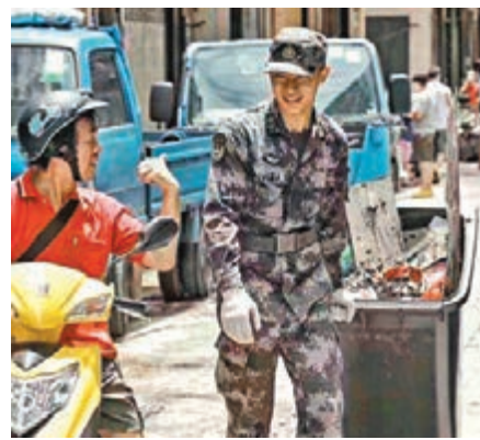
駐澳部隊力助澳門恢復市容,澳門居民都「Like」。fb圖片