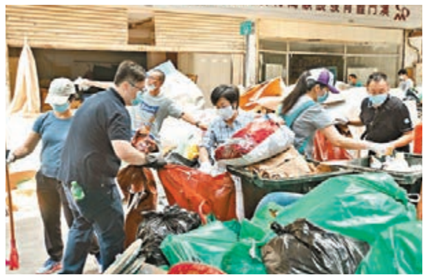
澳門行政法務司司長陳海帆(前左二)率千名公務員,和市民一起清理垃圾。

發言人最後表示,澳門社會素有守望相助、和衷共濟的優良傳統,相信天災無情人有情。在中央政府的關懷支持和特區政府的帶領下,只要社會各界大力弘揚「澳門精神」,眾志成城、並肩攜手、團結前行,就一定能戰勝災情困難,共建澳門美好家園。