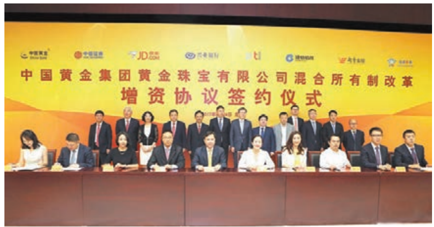
中金珠寶混改方案日前正式落地，引入了中信證券、京東、興業銀行、中融信託、建信信託、越秀金控和浚源資本7家戰略投資者。

香港文匯報訊 繼中國聯通之後，中國黃金集團旗下公司中金珠寶混改方案也落地。和訊網報道，中金珠寶8月24日在京舉行混合所有制改革增資協議簽約儀式，現場有30多家企業先後對參與中金珠寶混改項目成為戰略投資者表示出濃厚興趣，最終中金珠寶按照未來發展協同程度的原則引入了7家戰略投資者和一家產業投資者。