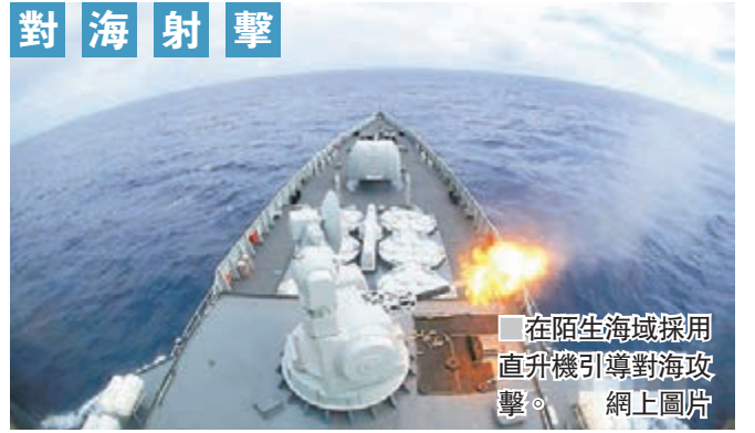
對海射擊 在陌生海域採用直升機引導對海攻擊。