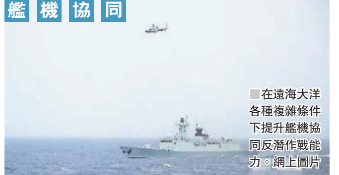
艦機協同 在遠海大洋各種複雜條件下提升艦機協同反潛作戰能力。網上圖片

據新華社報道，此次海上演練科目多、難度大、演練海區生疏。中方多次在陌生海域採用直升機引導對海攻擊和艦機協同反潛，並構設遭遇彈藥襲擊、潛艇威脅、強電磁干擾等複雜戰場環境，先後完成副炮對空射擊、對海打擊、對潛防禦等多個科目的訓練，全程檢驗艦艇編隊在遠海大洋各種複雜條件下的作戰能力。