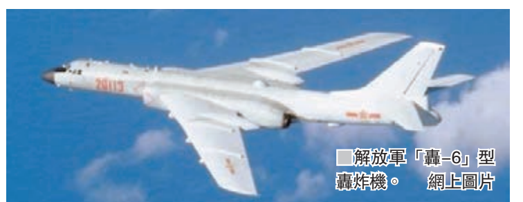
解放軍「轟-6」型轟炸機。網上圖片

報告認為，日方的所作所為，根本目的是為其大幅調整軍事安全政策、大力擴充軍備，甚至修改和平憲法製造借口，這種動向值得國際社會高度關注與警惕。